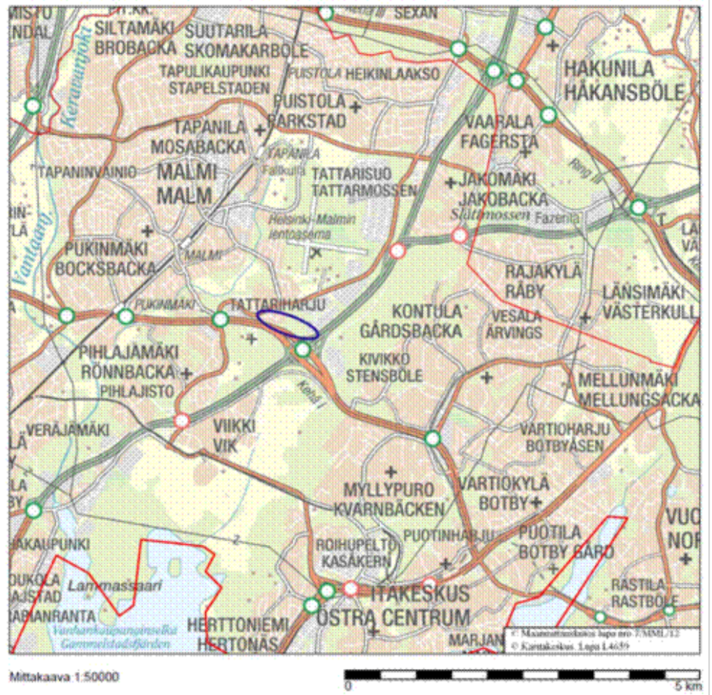
Kuva. Hankealueen sijainti sinisellä ympyröitynä.

Sepänmäen meluvalli toteutetaan rakentamalla noin 600 metriä pitkä ja maanpinnasta noin yhdeksän metriä korkea meluvalli. Rakentaminen tulee ajoittumaan sulanmaan aikaan, jolloin rakentamista harjoitetaan vuosittain noin 6–8 kuukautta. Rakentaminen tehdään arkisin klo 7–22 pois lukien arkipyhät.