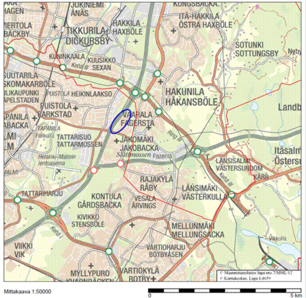
Kuva: Hankealueen sijainti sinisellä ympyröitynä.

Suurmetsän meluvalli toteutetaan rakentamalla noin 600 metriä pitkä meluvalli, joka on tien tasausviivasta noin kahdeksan metriä korkea. Rakentaminen tulee ajoittumaan sulanmaan aikaan, jolloin rakentamista harjoitetaan vuosittain noin 6–8 kuukautta. Rakentamista on tarkoitus tehdä arkisin klo 7–22 pois lukien arkipyhät.