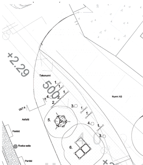
KUVA: TASAPAINO- JA PARKOUR-ALUE (alla)