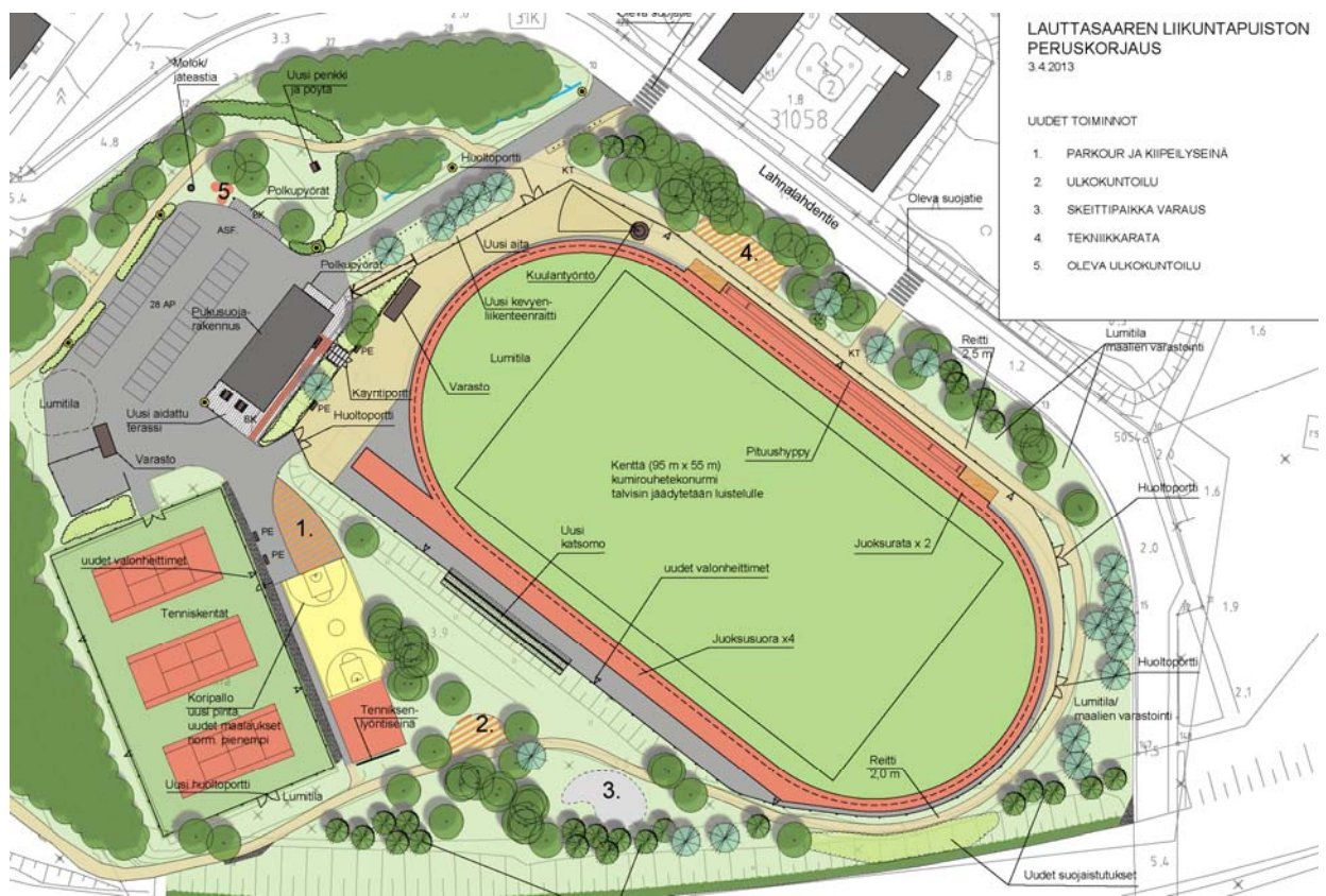
KUVA: OTE YLEISUUNNITELMASTA

Liikuntapuiston kehittämisen tavoitteena on luoda edellytykset korkeatasoisille lähiliikuntapalveluille. Tavoitteena peruskorjaukselle on alueen virkistys- ja liikuntatoimintojen monipuolistaminen, ympäristön viihtyisyyden lisääminen sekä alueen hoidon, ylläpidon ja valvonnan edellytyksien parantaminen.