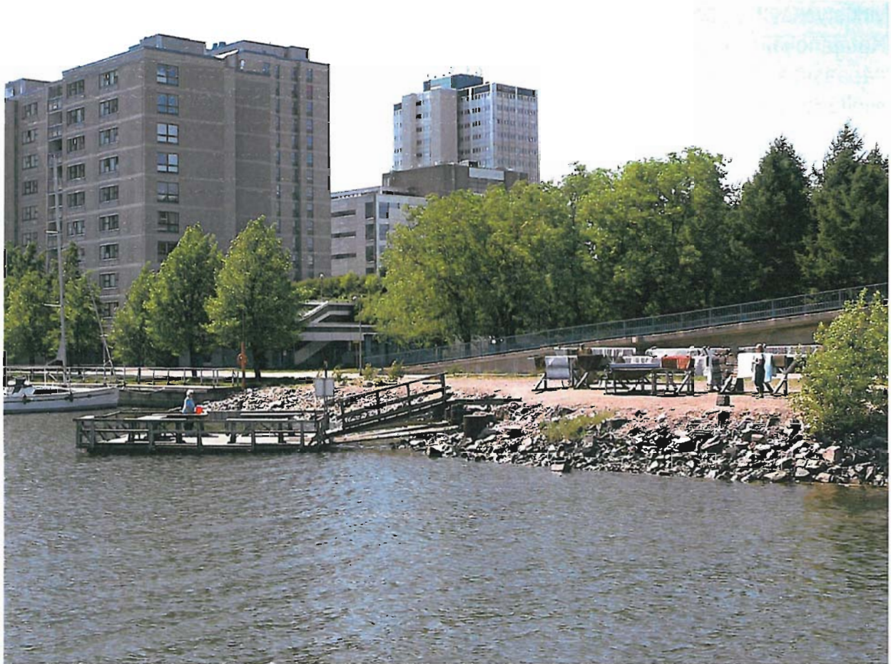
Sörnäisten rantatien mattolaituri

Kommentti: Paikalle voisi soveltua rannalle sijoitettu pesupaikka, koska tilaa on ja luultavasti viemäri kulkee Sörnäisten rantatiellä. Erityistä tieyhteyttä ei tarvitse rakentaa ja esim. pelkkä pysäköintialue Merihaan vieressä voisi riittää. Kaavoitustilanne on selvitettävä ennen suunnitelmia.