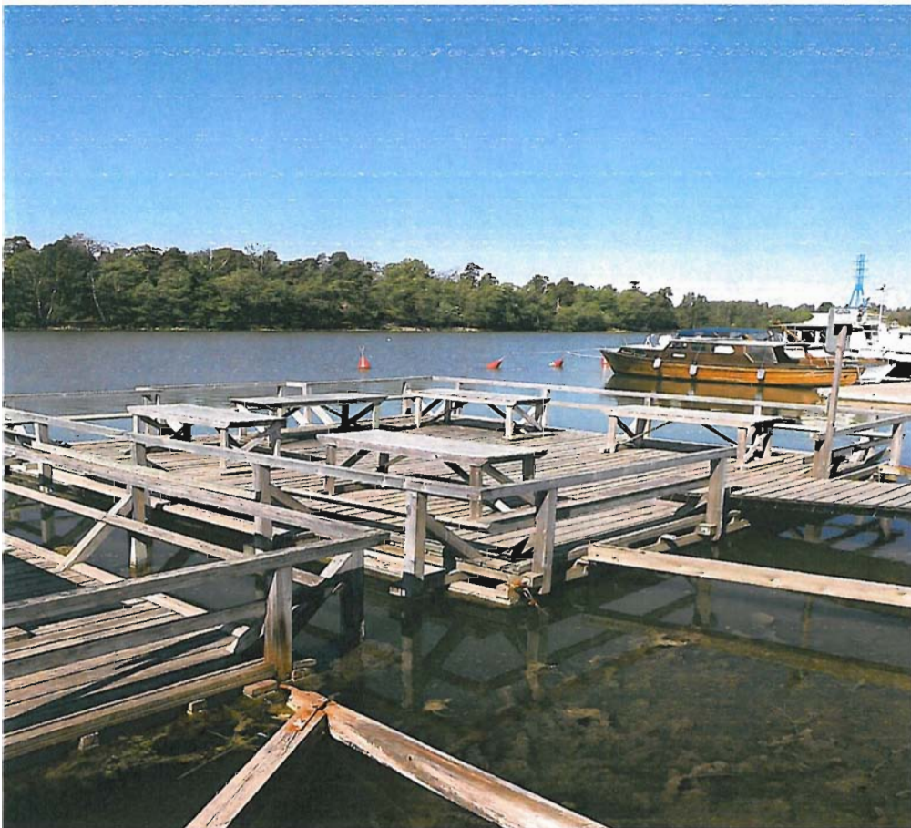
Humallahden mattolaituri Töölössä

Kommentti: Yksi laituri riittänee kyseisen lähialueen tarpeeseen eli joko Taivallahdesta tai Humallahdesta voisi luopua. Viemäroidyn paikan rakentaminen rannalle lähelle nykyisiä paikkoja ei ole mahdollista ilman pitkiä viemärivetoja ja liikennejärjestelyjä.