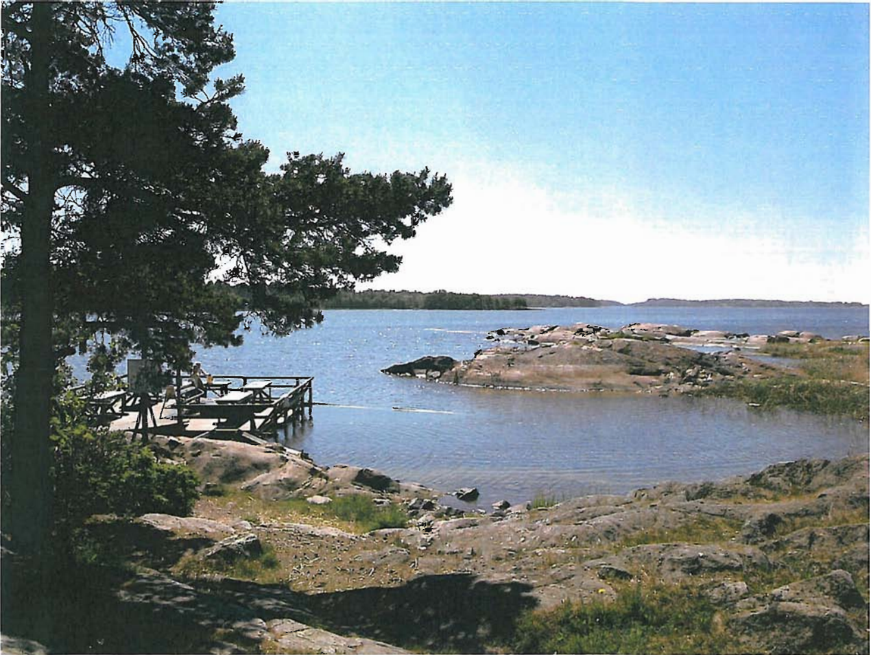
Hevossalmen mattolaituri Laajasalossa

Kommentti: Suositellaan tällä paikalla pesutoiminnan lopettamista kuormitukselle herkän vesiympäristön johdosta. Lisäksi paikka on vaikean kulkuyhteyden päässä. Viemäröinti tälle paikalle ei ole mahdollista.