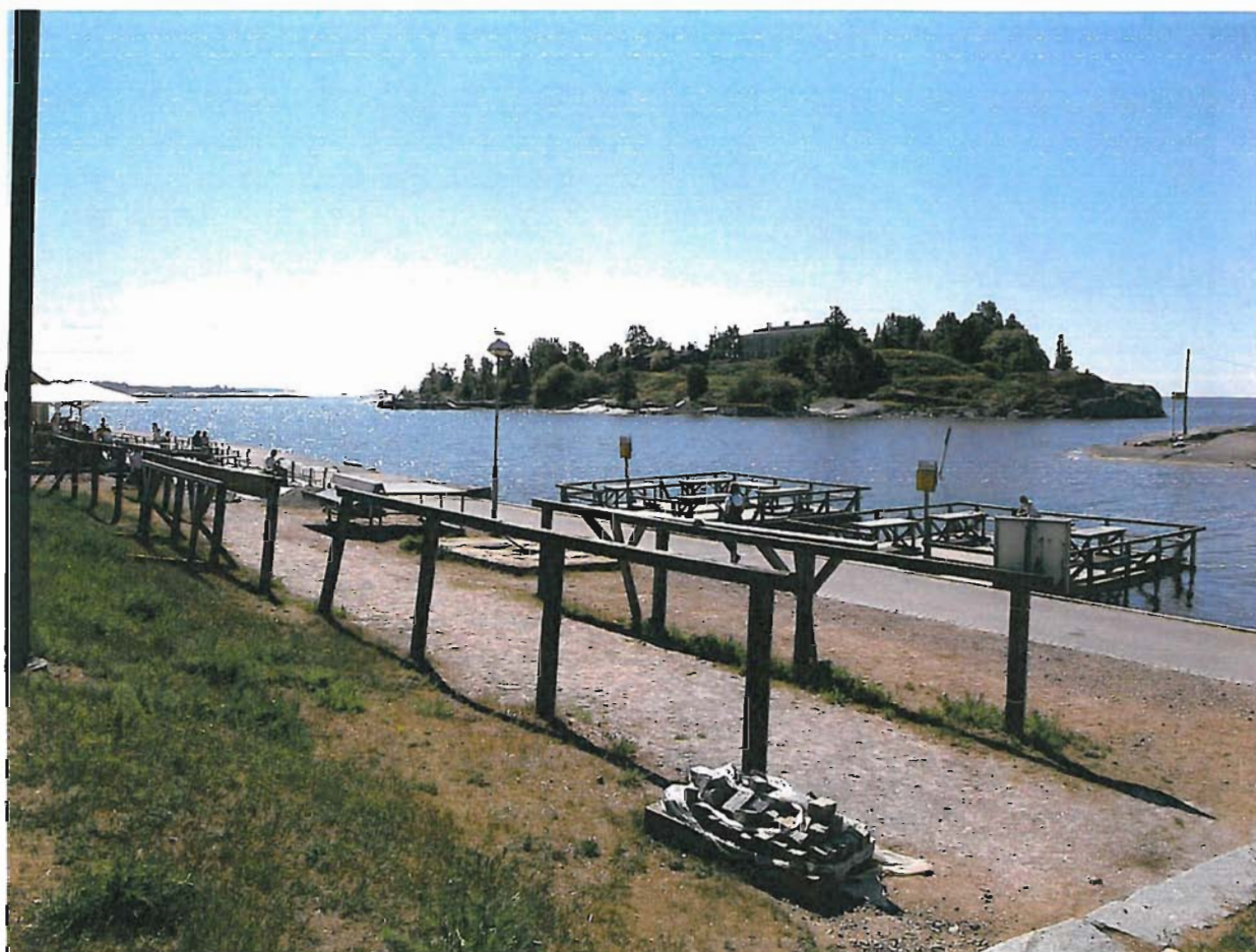
Merisataman mattolaituri Kaivopuistossa

Kommentti: Koko Merisatama-alueita tulisi kehittää monipuolisiin virkistystoimintoihin ja erilaisiin tapahtumiin soveltuvaksi paikaksi niin lapsiperheille kuin muillekin kaupunkilaisille sekä turisteille. Mattolaitureille voisi löytyä monenlaista muutakin käyttöä esim. osa vaikkapa läheisen kahvilan asiakaspaikkoina.