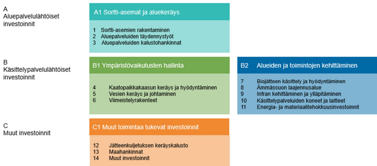
Kuva 1 Jätehuollon investointiohjelman korirakenne

Jätehuollon investointiohjelman rakenne perustuu korirakenteeseen, jossa investoinnit on jaettu kolmeen pääkokonaisuuteen ja 14 koriin. Pääkokonaisuudet ovat aluepalvelulähtöiset investoinnit, käsittelypalvelulähtöiset investoinnit ja muut investoinnit. Käsittelypalvelulähtöiset investoinnit jakaantuvat kahteen alakokonaisuuteen, jotka ovat ympäristövaikutusten hallinta sekä alueiden ja toimintojen kehittäminen. Jätehuollon investointiohjelman korirakenne on esitetty kuvassa 1.