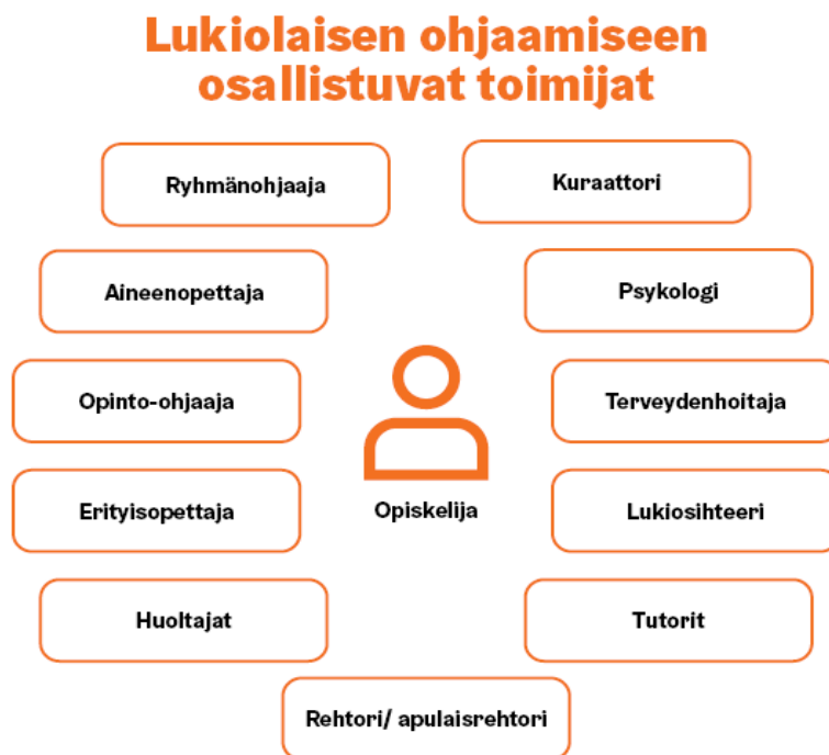
KUVA 1. Ohjauksen toimijat

Helsingin kaupungin lukioissa opiskelija on oman oppimisensa omistaja ja aktiivinen toimija, ja opiskelija on ohjauksen keskiössä. Helsingin kaupungin lukioissa toteutamme koko lukio ohjausperiaatetta, ja koko henkilöstömme on sitoutunut ohjaukseen ja ohjaa opiskelijaa. Ohjaus on tavoitteellisesti johdettua koko lukion yhteistä työtä, jossa eri toimijoiden välinen vuorovaikutus ja yhteistyö korostuvat.