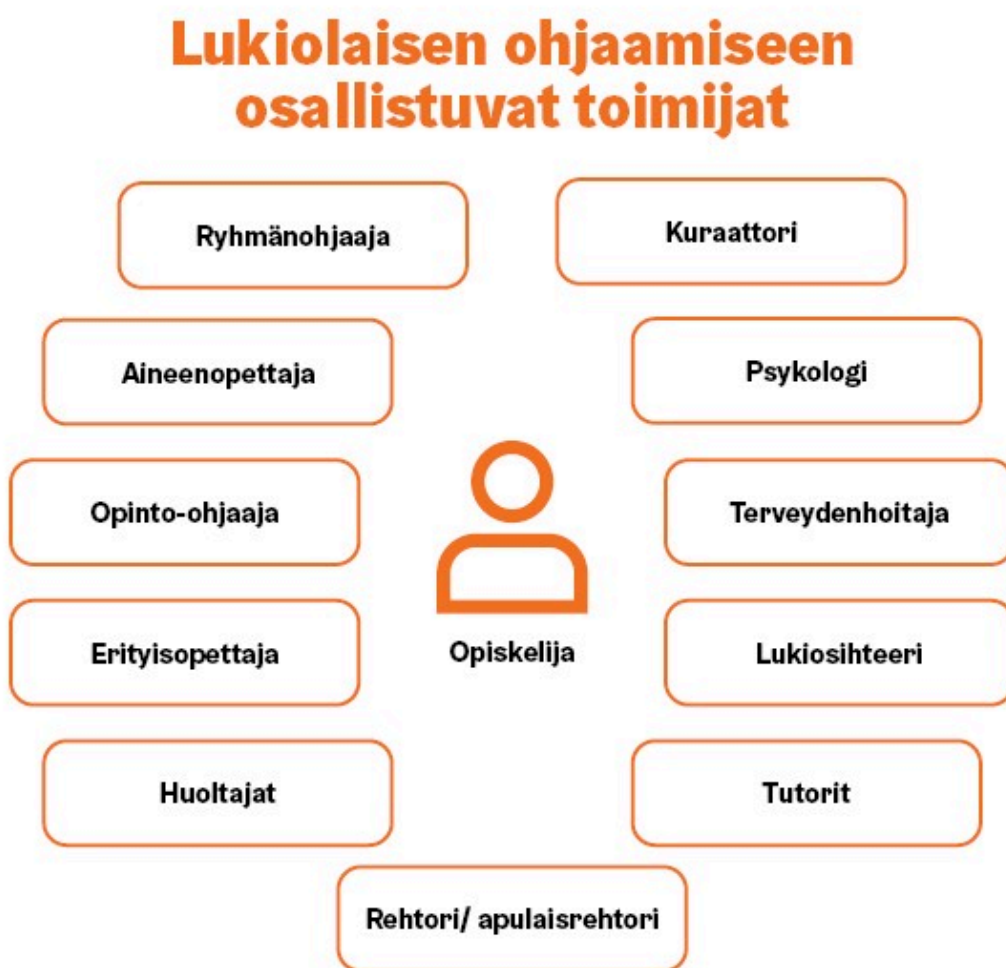
Kuva 1: Lukiolaisen ohjaamiseen osallistuvat toimijat

Helsingin kaupungin lukioissa opiskelija on oman oppimisensa omistaja ja aktiivinen toimija, ja opiskelija on ohjauksen keskiössä. Helsingin kaupungin lukioissa toteutamme koko lukio ohjaa-periaatetta, ja koko henkilöstömme on sitoutunut ohjaukseen ja ohjaa opiskelijaa. Ohjaus on tavoitteellisesti johdettua koko lukion yhteistä työtä, jossa eri toimijoiden välinen vuorovaikutus ja yhteistyö korostuvat.