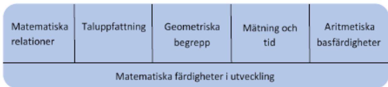
Figur 2. Centrala delområden för barnens matematiska utveckling i förskoleundervisningen.

Barnen ska uppmuntras att fundera över och beskriva sina matematiska observationer i olika vardagliga situationer med hjälp av att läraren beskriver och sätter ord på företeelserna. Barnen ska uppmuntras att dela sina iakttagelser med varandra och på det sättet fördjupa det kollaborativa tänkandet, problemlösningsfärdigheterna och aktiviteten. Verksamheten ska planeras så att den erbjuder barnen möjligheter att lära sig och använda matematiska begrepp, klassificera, jämföra och rangordna saker och ting och att hitta och skapa lagbundenheter. Undervisningen ska omfatta lekar och uppgifter som utvecklar minnesförmågan och det logiska tänkandet. Undervisningen ska vara lekfull och man ska bland annat använda lekar, spel och berättelser samt digitala verktyg.