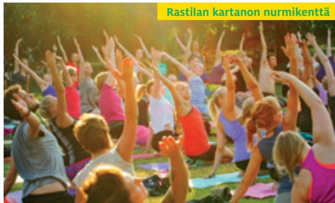
Rastilan kartanon nurmikenttä

Kartanon nurmikenttä antaa loistavat puitteet aktiviteettien ja tapahtumien järjestämiseen.