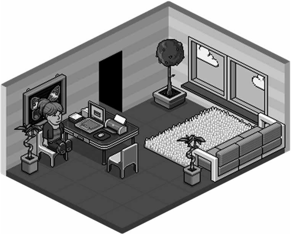
Kuva 1. Verkkoterkkareiden huone Habbo Hotelissa.

Lasten ja nuorten verkkososiaalipalvelut (Vespa) -hanketta hallinnoi Helsingin sosiaaliviraston kehittämisspalveluiden Lapsen ääni -kehittämisohjelma, ja se kuuluu sosiaali- ja terveysministeriön rahoittamaan valtakunnalliseen Kaste-ohjelmaan (STM 2011). Vespa-hanke aloitti toimintansa syksyllä 2009 ja hankkeen on määrä jatkua vuoden 2012 loppuun. Netarin työntekijät vaikuttivat paljon Vespa-hankkeen syntyyn olemalla sinnikkäästi yhteydessä sosiaalivirastoon ja ideoimalla sen kanssa sosiaalityöntekijöiden mahdollisuutta osallistua nuorille suunnatun verkkotyön kehittämiseen yhteistyössä Netarin kanssa. Vespa-hankekin on siis alusta saakka suunniteltu toimimaan Netarin ja Verkkoterkkareiden kanssa tiiviissä yhteistyössä. Hankkeessa työskentelee projektikoordinaattori sekä sosiaalityöntekijä, ja osan aikaa hankkeessa on ollut myös psykiatrinen sairaanhoitaja. Hankkeen tavoitteena on kehittää sosiaalialan matalan kynnyksen verkkopalveluita sekä tukea lasten ja nuorten psykososiaalista kehitystä tunnistamalla ajoissa erityistä tukea tarvitsevat lapset ja nuoret, jotka asioivat verkkonuurisotyön palveluissa. Hankkeen tarkoitus on myös osallistua moniammatilliseen verkkopalveluprosessiin ja osallistaa nuoria verkkopalveluiden kehittämistyöhön. Vespa-hankkeen nuorille suunnattua palvelua on mainostettu sosiaalisen median ympäristöissä Teinihopperi-nimellä. Vespa-hanke on kehittänyt ja tarjonnut palveluitaan samoissa ympäristöissä Netarin ja Verkkoterkkareiden kanssa.