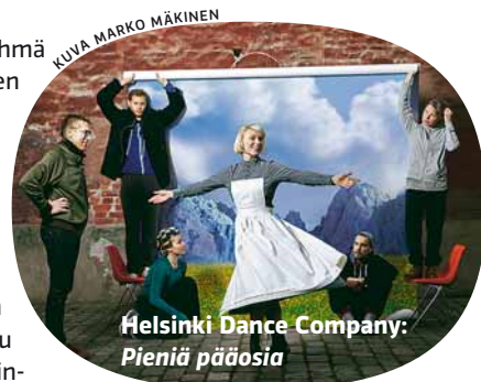
Helsinki Dance Company: Pieniä pääosia