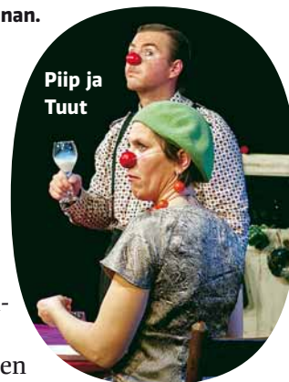
Piip ja Tuut

BRAVOI-FESTIVAALI tuo Annantaloon kansainvälistä teatteria. Maksuton avajaispäivän ohjelma 13.3. kello 13–15 alkaa klovniverusten Piip ja Tuut tapaamisella kirjakahvilassa ja jatkuu varjoteatteri- ja draamatyöpajoissa. Kello 14.30–15.20 nähdään ranskalaisen Compagnie Pupella-Noguésin Täällä ja siellä jos-sain (suositusikä 5+, liput 5 e, esittely suomeksi ennen näytöstä), joka kuvaa sitä, kuinka tavarat sun muut kertovat elämästämme. 15.3. kello 18–18.50 nähdään hurmaava klovniesitys Piip ja Tuut suuresta rakkaudesta. Virolaisen Piip ja Tuut Teatterin sanaton esitys sopii yli 6-vuotiaille. Tiketakin esityksessä Pikkukarhu saa pikkusiskon pikkukarhu koristelee kodin ystäviensä kanssa ja etsii lahjaa siskon tervetulojuhlaan. Italiankielinen esitys on 20.3. kello 13 ja 15 (klo 12.15 ja 14.15 leikkisessä työpajassa opitaan esityksen avainsanoja), ikäsuositus 1+ perheineen, kesto 35 min. Liput esityksiin 5 euroa, p. 09 310 12000, kulttuurikeskuksen talot ja ovelta 0,5 h ennen esitystä, jos lippuja on jäljellä.