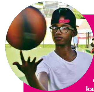
Hämis, 18 v

Vuosaarelaiset toimijat laittoivat hynntyyt yhteen ja järjestivät nuorten kanssa monikulttuurisen Vuokin kesän, joka työllisti 20 nuorta.