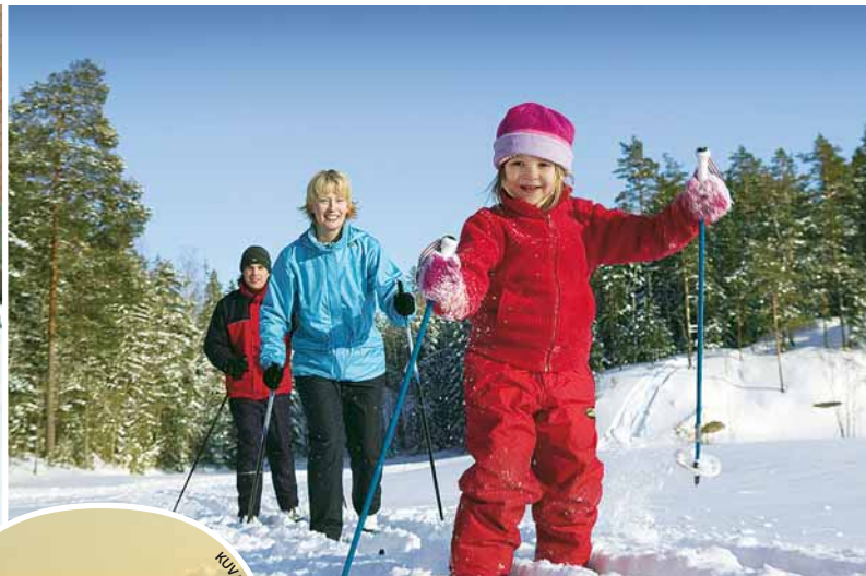
KUVA COMMA IMAGE