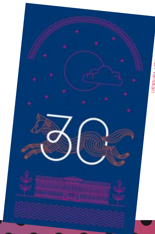
Kuvitus: Hannamari Vahikari