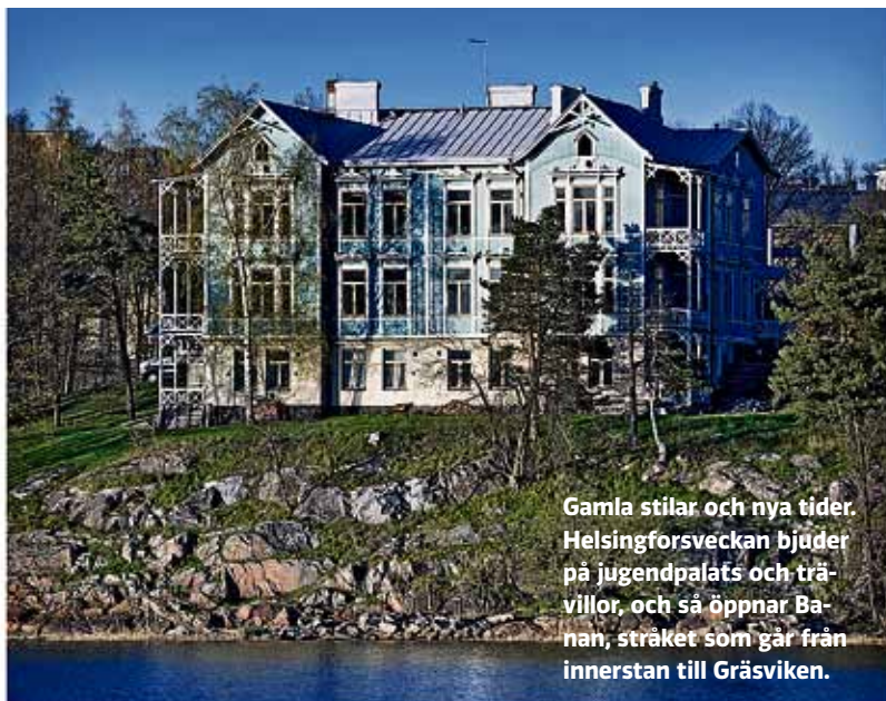
Gamla stilar och nya tider. Helsingforsveckan bjuder på jugendpalats och trävillor, och så öppnar Banan, stråket som går från innerstan till Gräsviken.

Ytterligare perspektiv på stadsbilden ger den guidade turen i Nordsjö och så det historiska dramat utgående från Carl Ludvig Engel och hans samtida. Och så kan man ta del av temat Helsingfors 200 år som huvudstad genom att flanera med guide längs Alexandersgatan. Rutten med namnet På andra sidan om Långa bron skildrar arbetarstadsdelen Berghäll och något av den urbana staden i ett nötskal ger presentationen av finsk skodesign med start vid Norra esplanaden. Bulevarden från öster till väster ger en inblick i stadens arkitekturstilar, liksom