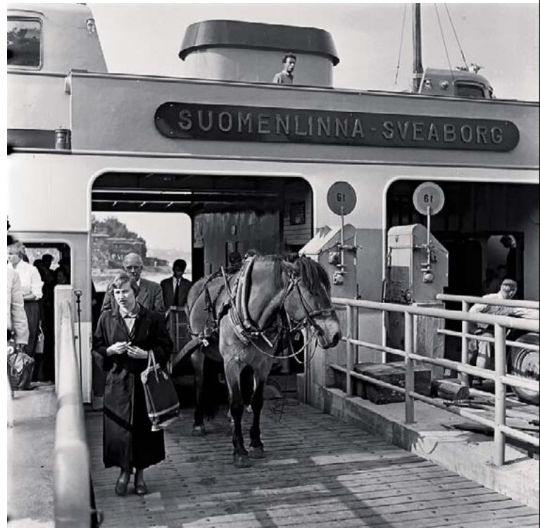
Suomenlinnan lautan matkustajia. Volker von Boninin kuva on vuodelta 1955.

keutensa, se muun muassa joutui tuulijolle sähköongelmien vuoksi ja törmäsi useamman kerran laitureihin. Lautta kävi telakalla paranneltavana ja on sittemmin palvellut moitteetta. Kova jäätalvi 2010 oli yksi osoitus siitä, että Suomenlinna II täyttää tehtävänsä.