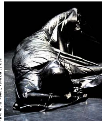
kuvassa Sylfidit

• 6. & 7.11. klo 19 You've changed. Thomas Hauertin teos näyttää moniäänisenä, virtuoottis-