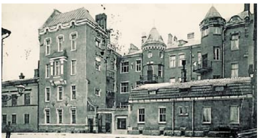
Kuva postilahti, yksityiskokokuva

Vastaukset pyydetään toimittamaan viimeistään 22.11. osoitteella Helsinki-info, "Lukijakilpailu", PL 1, 00099 Helsingin kaupunki tai sähköpostitse osoit-