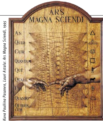
Kuva Paulline Pasanen, Lauri Astala: Ars Magna Sciendi, 1995

Astalalla on kyky yhdistää viileän terävä tekniikka epätoollisiin tunnelmiin. Hänen taiteessaan tapahtuu mahdottomia kuin Liisalle ihmemaassa. Meilahdessa voi hämmästellä Astalan keskeisiä veistoksia, videoita ja videoinstallaatioita reilun kahden vuosikymmenen ajalta. Astalan taiteen punaisena lan-