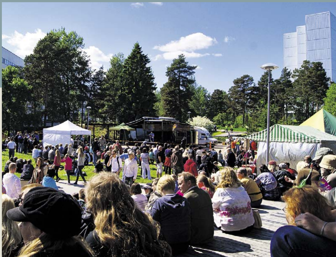
Pihlajamäki goes Blues -festivaali Kiillepuistossa kesäkuussa.