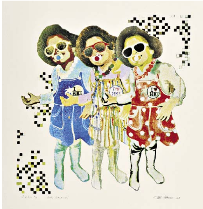
Töölössä Museokadun ja Minervankadun kulmauksen jakokaappin taideteos on nimeltään Little Entertainer ja sen on tehnyt Reetta Hiltunen .

Museokadulla ja sen kulmilla töihin kuuluu muun muassa