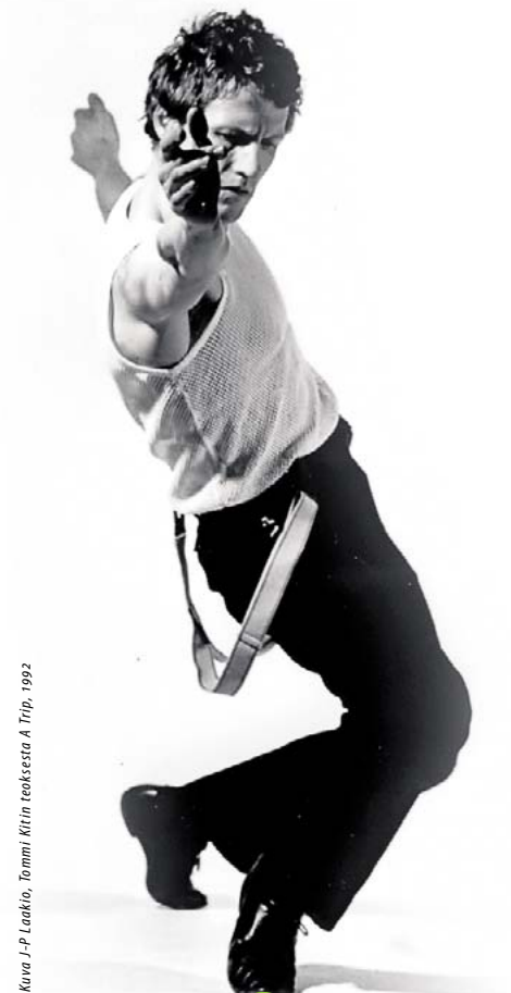
Kuva J.-P. Laakso, Tommi Kittin teoksesta A Trip, 1992

” V anhoissa, 1800-luvun hellahuoneissa oli yleensä vain tavallinen kaakeliuuni. Se lämmitti hyvin, mutta ruoanlaitto oli hankalaa. Ruoanlaittaja joutui kyykimään uunin edessä ja hämmentämään tulipesässä avotulella kolmija-