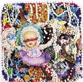
Kuva Kalle Katella, Tuija Markonsalo: Cup street, 2010

nähtävänä ovat räväkät teokset on tehty kuvataidetta, käsityötä, korutaidetta ja tekstiilitaidetta yhdistäen. Taiteilija Tuija Markonsalo on suunnannut näyt-