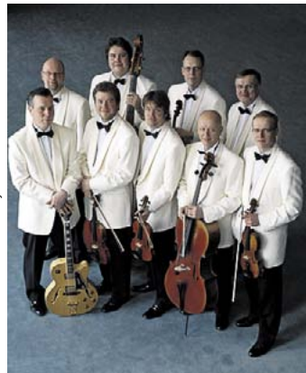
Kuvassa Filarmoninen viihdejousikko

ja rockabillyn mahtiklassikoita suomeksi ja englanniksi, liput 12/10 e. • Vuotalo, Mosaiikkitori 2, www.vuotalo.fi. Lipunmyynti p. 09 310 12000 (ma–pe klo 12–18, vain pvm) vuotalo.lipunmyynti@hel.fi ja Lippupalvelu.