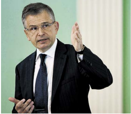
Kaupunginjohtaja Jussi Pajunen esitteli talousarvioehdotuksensa kaupungintalolla 1. lokakuuta.

hitysohjelman edellyttämiin hankkeisiin on taloussuunnitelmassa varauduttu investoimaan noin 128 miljoonaa euroa.