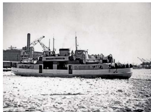
I. Raekallio ikuisti jäissä etenevän lautan vuonna 1976.

Suomenlinna II otti ensimmäiset matkustajansa kesäkuussa 2004. Uudella lautallakin oli alkuvai-