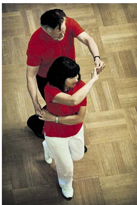
Terapi och motion. Dans är bra för det mesta.

ur sin andra bok bestående av hennes kåserier i Hbl. Det är inte ovanligt att femtio sextio personer kommer på träffarna som ordnas klockan 14 den första tisdagen varje månad. Inget inträde eller krav på anmälan.