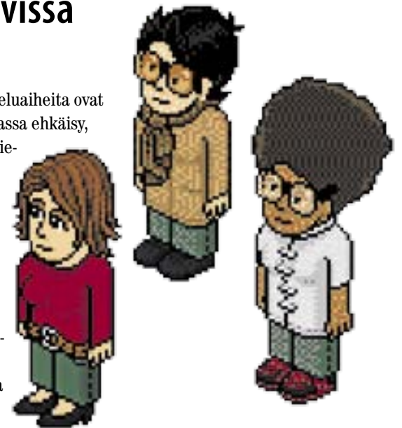
Terveydenhoitajat Lumitalvikki, Pihla-Elviira ja Sanelmamma ovat tavattavissa Habbo-Netarissa joka toinen maanantai, parittomina viikkoina.

• Lisätietoa: www.hel.fi/terveyskeskus > Hankkeet > Verkkoterkkari-hanke 2008–2010.