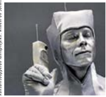
Kansallisoopperan lähiöprojekti: Nimeni on Sormiradio, kuva Jaakko Pesonen