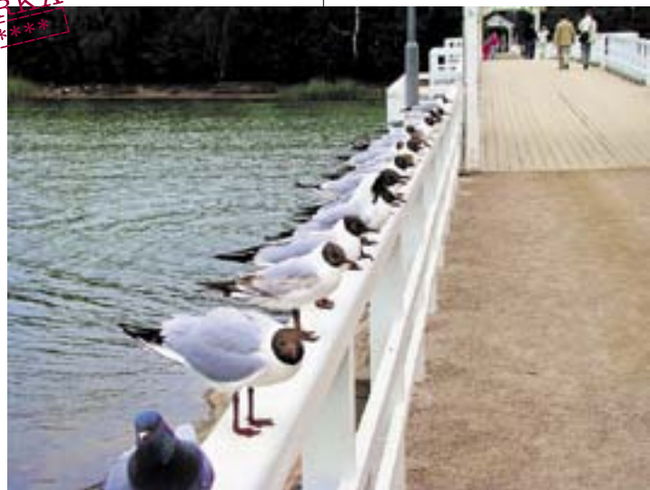
Bulgarian suurlähettiläs Plamen Bonchevin kuva Seurasaaren sillalta on saanut nimekseen Arkaa uteliaisuutta.