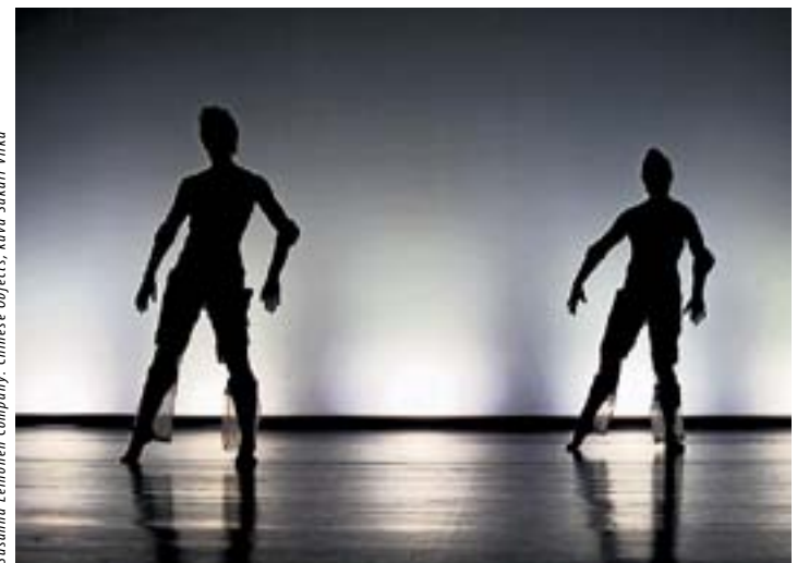
Susanna Leinonen Company, Chinese Objects