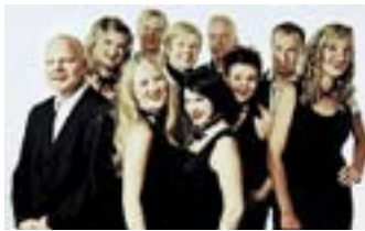
Kitkerät neitsyet

Stoa naistenpäivän konsertissa viiden laulavan naisen ja viiden soittavan miehen kabareehenkinen yhtye, Kitkerät neitsyet tarjoaa kuulijoilleen ikä- ja sukupuolirajoja rikkovaa kiperää ironiaa, iskeviä riimejä sekä laajaa musiikillista epämääräisyyttä. Yhtyeen perustemoina ovat tasa-arvokysymykset ja luutuneiden sukupuoliroolien hämmentely sekä pilkka. Yhtye piirtää vuoroin terävää, vuoroin reippaan tähtänyttä ajankuvaa, jossa piikki osuu yhtä lailla työelämän kuin kotipuolen akupunktiopisteisiin: uusliberalismi, tehokkuuden ja tuottavuuden