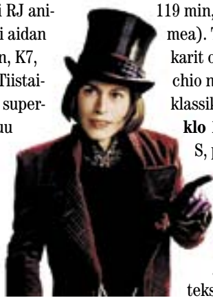
Jali ja suklaatehdas

K7, puhutaan suomea). Päivän lisäantina herkutellaan ranskalaisessa ravintolamiljöössä yhdessä kokkirotta Remyn kanssa, elokuvan nimi on Rottatouille ( klo 12 ja 16 , 103 min, K3, puhutaan suomea). Viikon puolivälissä valkokankaalla seikkailee Disneyn ikisuosittu Bambi ( 24.2. klo 10 ja 14 , 63 min, K3, puhutaan suomea), sekä sen parina japanilainen piirroselokuva Liikkuva linna ( klo 11.30 ja 15.30 , 119 min, K7, puhutaan suomea). Torstain filmisarjat ovat poikia: Pinocchio nimeään kantavassa klassikkofilmissä ( 25.2. klo 10 ja 14 , 84 min, S, puhutaan suomea) sekä ruotsalainen Håkan elokuvassa Poika ja kilpikonna ( klo 12 ja 16 , 79 min, K3, tekstitys suomeksi).