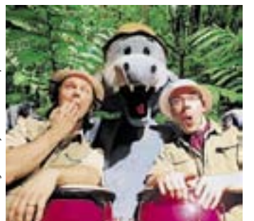
Aarne Alligaattori ja Viidakkorumpu-bändi

• Vuotalo, Mosaiikkitori 2, www.vuotalo.fi