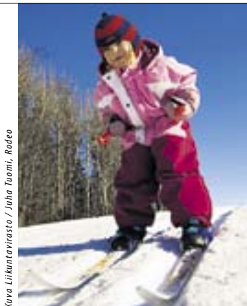
Kuva Liikuntamylystä / Juha Tuomi, Redeo

Liikuntamylyssä järjestetään keskiviikkona 24.2. klo 15–18 FunAction-tapahtuma 13–17-vuotiaille nuorille. Ohjelmassa on muun muassa parkouria, seinäkiipeilyä ja jousiammuntaa. Tilaisuus on maksuton. Liikuntamyly, Myllypurontie 1, p. (09) 310 87535.