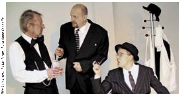
Elämänteatteri: Rakas lurjus

• Liput 12/8 e, (09) 310 12000, stoa.lipunmyynti@hel.fi tai Lippupalvelu. • Stoa Itä-Helsingin kulttuurikeskus, Turunlinnantie 1, www.stoa.fi