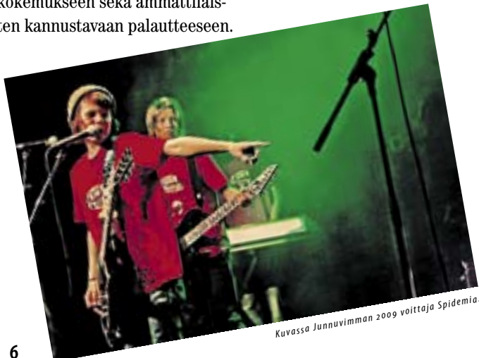
Kuvassa Junnuvimman 2009 voittaja Spidemia.

• Lisätietoja Junnuvimmassa saa osoitteesta www.nuoriso.hel.fi/aanijavimma