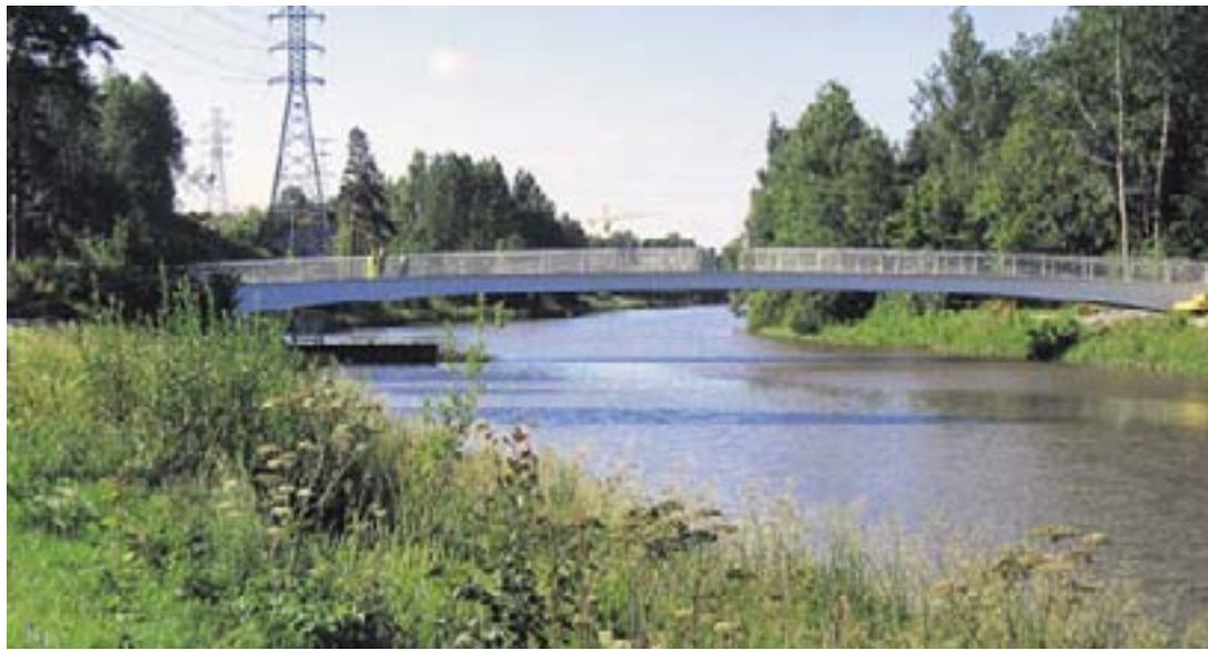
Ulkoilijat pääsevät Vantaanjoen yli Viikinmäessä uutta, neljä metriä leveää siltaa pitkin.

Lokakuun aikana tehtävissä hoitotöissä poistetaan vesakkoa, lehtipuiden taimia, pajuja ja valdelmapensaita.