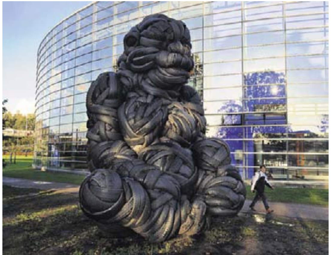
Viikin Infokeskuksen vieressä katseita vangitseva jättimäinen gorilla-veistos on tehty käytetyistä autonrenkaista.