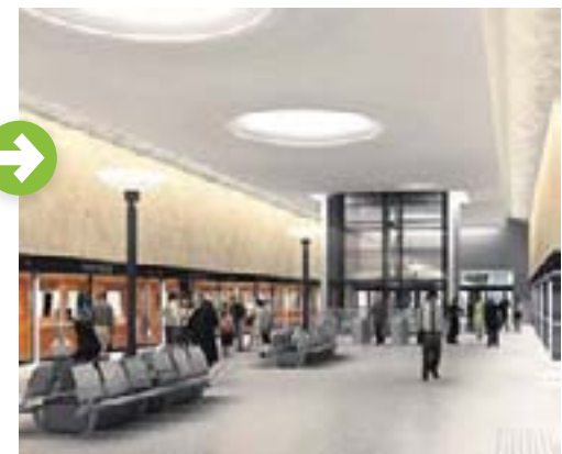
alustava havainnekuva Tapiolan asemalta.

10-11 Helsinkiin on saatu kolme uutta nuorisotilaa Arabiaan, Sörnäisiin ja Östersundomiin. Niissä on toimintaa soitonopetuksesta leffailtoihin. Suomen suurin nuorten toimintakeskus Happi keräsi tupareihinsa sa-doittain kävijöitä.