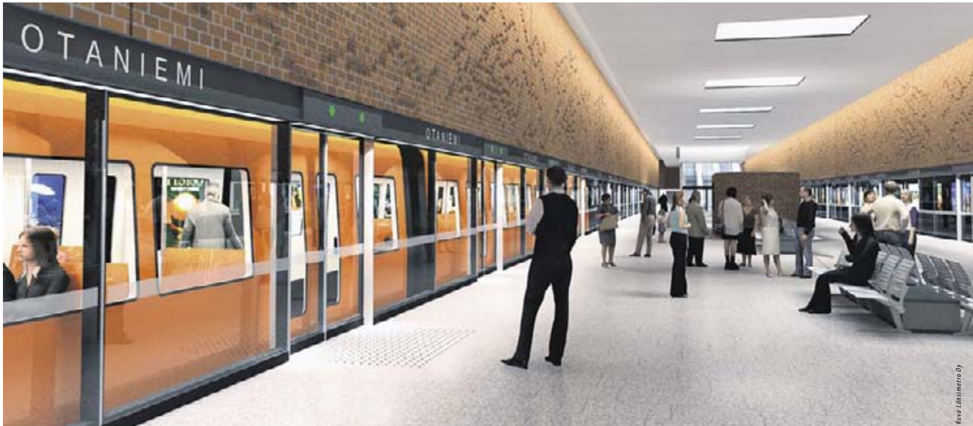
Laituriövet ja hyvä valaistus lisäävät turvallisuutta asemilla. Alustava havainnekuva Otaniemen asemalta.