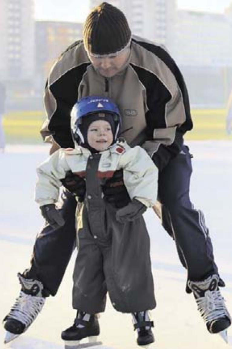
Luistelukausi alkoi jo jäähalleissa. Pirkkolan, Malmin, Myllypuron ja Paloheinän jäähalleissa järjestetään maksuttomia yleisöluisteluvuoroja. Tarjolla on aikoja sekä mailojen kera että mailatta luisteleville.