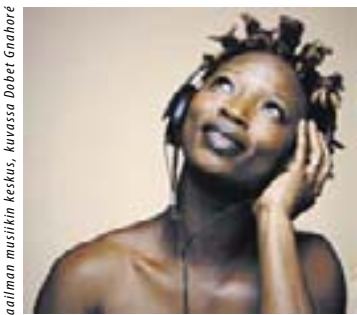
Kuvassa Dobet Gnahoré

Kaiken edellä mainitun lisäksi on luvassa paljon muuta. Alla muutamia poimintoja ohjelmasta, tarkat ohjelmatie-dot: www.globalmusic.fi/etnosoi. • 6.11. klo 19.30 Savoy-teatteri. Romengo (Unkari). Liput 28/24 e