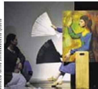
Kuvassa Tarina sinimekkoisesta tytöstä

• Nukketeatterikeskus Poiju: Kavioiden kopinat nähdään 25.11. klo 10 ja Cirókas Bábszínház: Tarina sinimekkoisesta tytöstä 20.11. klo 9 & 10.30 , 21.11. klo 14 .