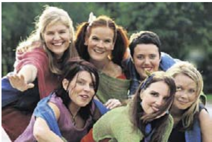
Kuvassa lauluyhtye Ketsurat