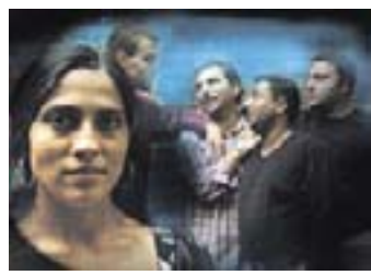
Kuvassa Savoy-teatteri / Maailman musiikin keskus, kuvassa Romengo