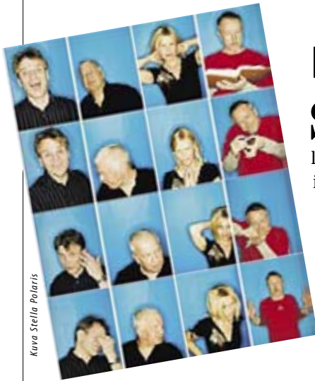
Kuva Stella Polaris