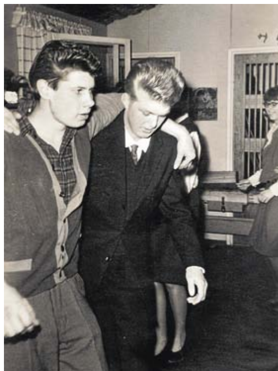
Kuvaja tunteeton / kerännyt Stig Sundholm.

Arkisin on ohjelmaa kello 17–19. Maanantaina 9.3. kuunnellaan hanurimusiikkia, tiistaina 10.3. opetetaan