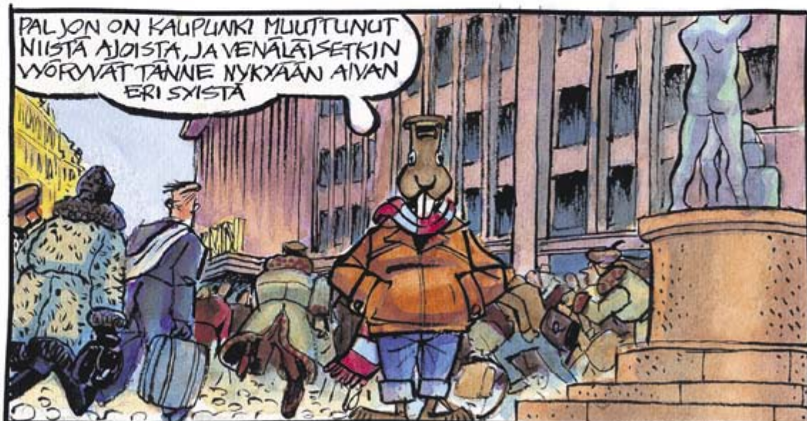
Piirränyt ja käsikirjoittanut Arto Nyyssönen