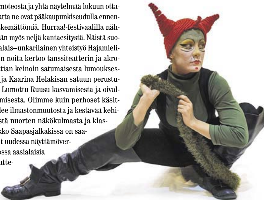
kuvassa Saapasjalkakissa.

• Ohjelmistoon ja esityspaikkoihin voi tutustua netissä osoitteessa www.hurraa.org .