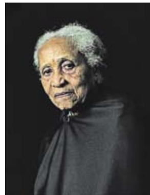
© Courtesy Pierre Gonnard and Juana de Alzupuru Gallery, Pierre Gonnard: Olympe, 2005.

• Liput: 7/5 euroa, alle 18-vuotiaat ilmaiseksi. Perjantaisin maksuton sisäänpääsy.