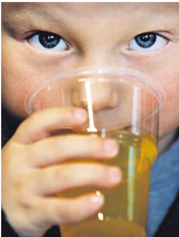
Smakar gott. Först en skojig föreställning, sedan saft och hex. Saftsalongerna är avsedda för ganska små barn.