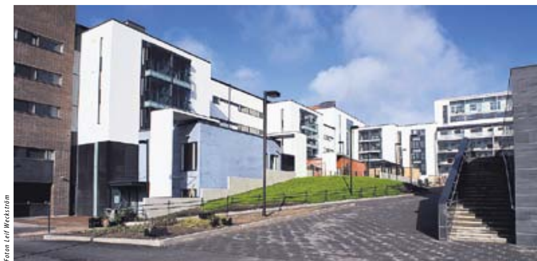
Stram stil. Sesam är skolor, boende och mycket mer.

I Sesam finns dessutom nästan 140 bostäder varav 32 är genomförda av Helsingfors svenska bostadsstiftelse. Bakom de övriga står OP-Eläkekassa.