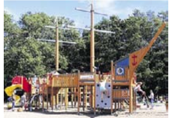
Lauttasaaren liikuntalaiva kutsuu seikkailemaan.