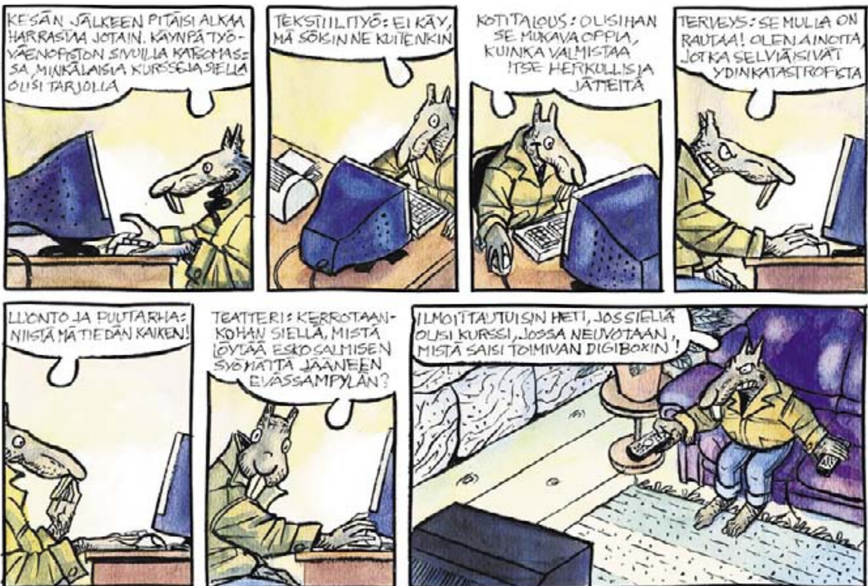
Piirtänyt ja käsikirjoittanut Arto Nyyssönen