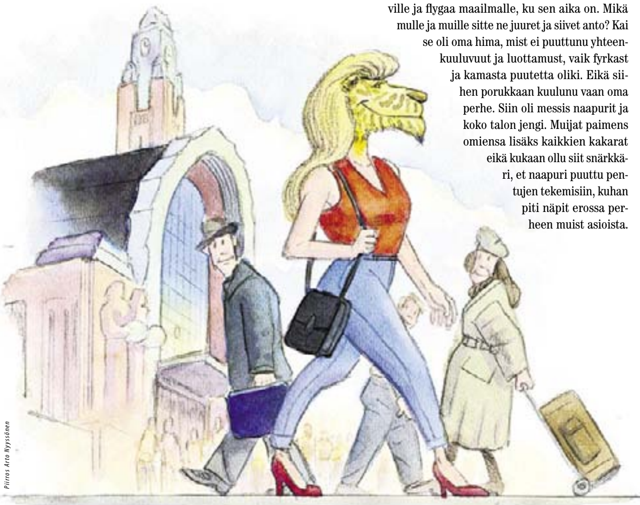
Piirros Arto Myssönen