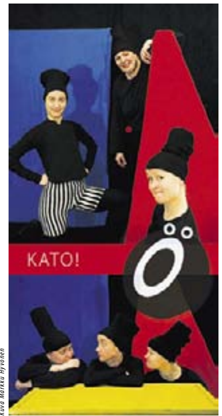
Teatteri ILMI Ö:n esitys KATO! sopii mainiosti taaperoikäisille ensikokemukseksi teatterimaailmasta. Esitykset Malmitalossa lauantaina 29.9. klo 14 ja 16.

• La 29.9. klo 14 ja 16 KATO! Kesto n. 30 min. Malmitalo, Ala-Malmin tori 1, www.malmitalo.fi. Liput 4 e. Lipunmyynti p. 310 12000 ja Lippupalvelu.