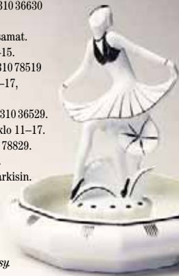
keuhkon valmistama Art Deco -tyylinen kukkamalli 1930-luvulta.

• Lisätietoja löytyy www.helsinginkaupunginmuseo.fi -nettisivuilta.