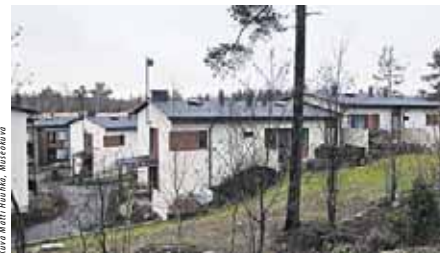
Kare Meri Iirinen, Murekava

Nykyisistä Myllypuron yli 9000 asukkaasta lähes 14 prosenttia on ulkomaalaistaustaisia, mikä on selvästi