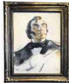
Fredrik Cygnaeus (1807–1881) oli ulkomäöltään huoliteltu persoonallisuus.

Myöhemmin hän matkusteli laajalti Euroopassa ja julkaisi lukuisan määrän runoja. Suomalaisen kansallistunnon herättäjänä hän tuli kuuluisaksi Kuntahden kentällä pitämänsä puheen ansiosta vuonna 1848. Samassa tilaisuudessa esi-