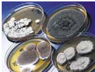
Kosteusvaurioituneista rakennusmateriaaleista otetut näytteet sisältävät eri homesukuja.

Jos asukas haluaa tutkituttaa huoneilmaa tai rakenteita esimerkiksi kosteusvauriota epäillään, on oikea yhteydenottoaika ympäristökeskuksen neuvonta. Sieltä hänet ohjataan kulloinkin vapaana olevan asiantuntijan luo.