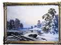
Ferdinand von Wrightin maalauksesta "Talvimaaisema Haminalahdelta" julkaistaan tänä vuonna postimerkki.

tettiin myös ensimmäistä kertaa Paciuksen säveltämä Maamme-laulu.