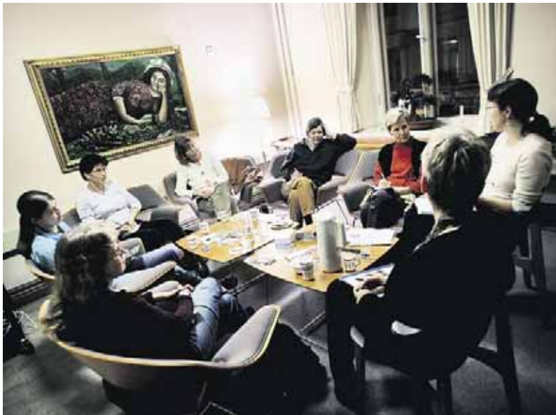
Ord om ord. Läsecirkeln på Richardsgatans bibliotek möts en gång i månaden och pratar om läsoplevelser.