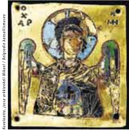
Kuvataiteen museo, jossa arkkitehtien Mikael / Belgradin kansallismuseo

Tennispalatsissa Helsingin kaupungin taidemuseossa jatkuu 21.1. asti näyttely, joka esittelee pyhän Athos-vuoren aarteita. Näyttelyyn on saatu lainaksi laaja kokoelma Athos-vuoren luostareissa tuhannen vuoden aikana tehtyjä ikoneita, käsikirjoituksia, dokumentteja sekä sakraaliesineistöä. Kokoelma ker- too kuvien ja esineiden välityksellä elämästä suljetulla, ainoastaan miehille salitulla niemimaalla.