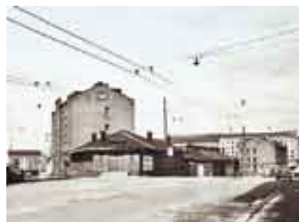
Kuva C. Grünberg, 1936, Helsingin kaupunginmuseo

Vastaukset pyydetään lähettämään 20.12. mennessä osoitteella Helsinki-info,