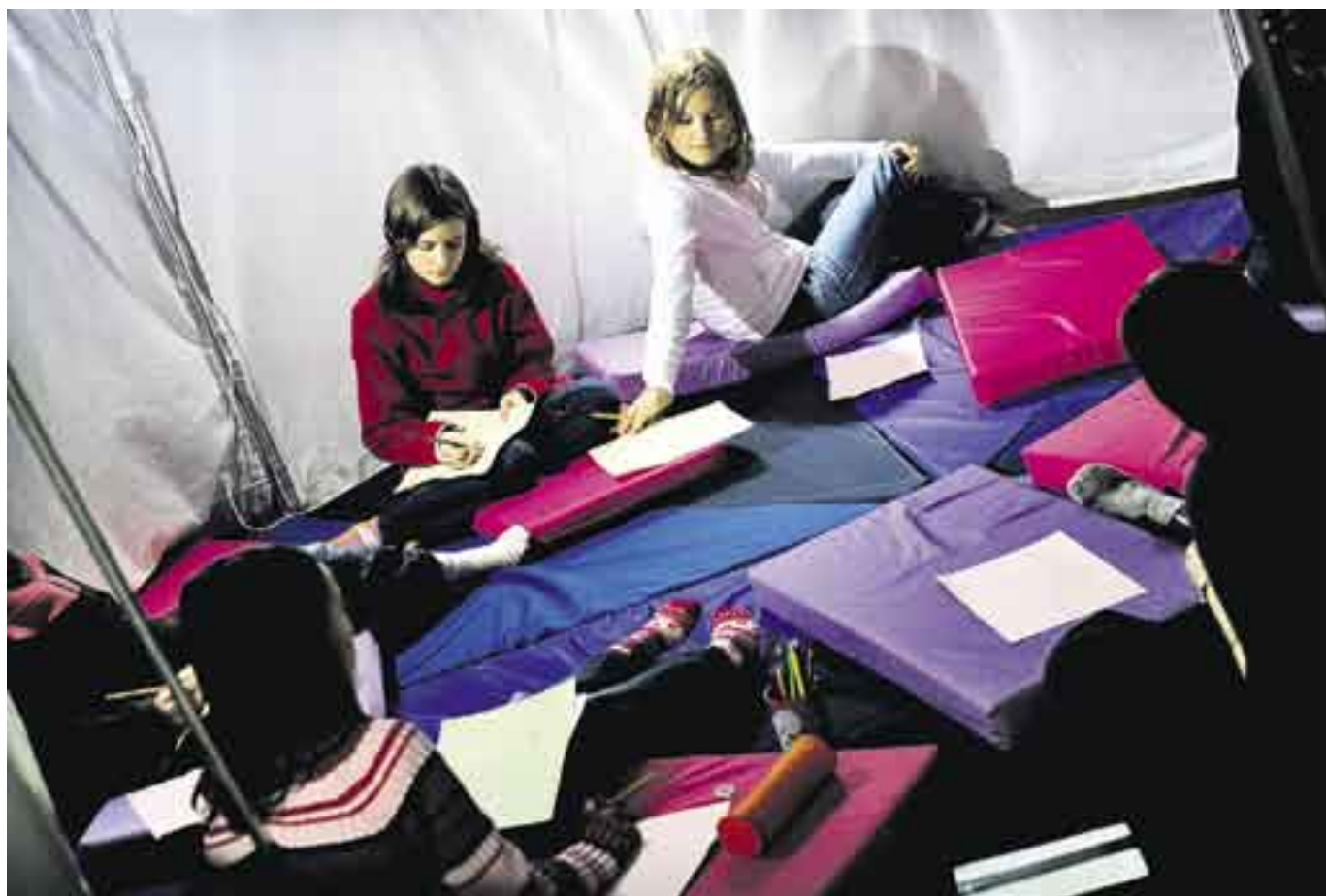
Papper, penna och fantasi är ordverktyg i verkstaden på Richardsgatans bibliotek.