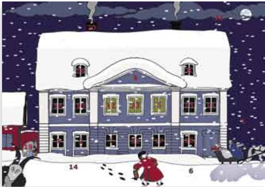
Jouluihin Helsinki näytti 250 vuotta sitten hyvin erilaiselta kuin nykyään.

Helsinginseutu.fi on toteutettu pääkaupunkiseudun kaupunkien tietotekniikka- ja viestintäyksiköiden yhteistyönä. Visuaalisen ilmeen on suunnitellut 2ndhead Oy. Portaali toteutetaan alkuun suomen- ja ruotsinkielisenä. Ruotsinkielisten verkkosivujen osoite on www.helsingforsregionen.fi . Myöhemmin avataan supistettu englanninkielinen palvelu osoitteessa www.helsinkiregion.fi .