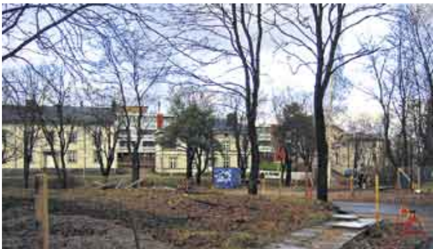
Vanha ja uusi kohtaavat. Hermannin historiallisesta laitakaupungista on jäljellä vie- lä muutaman vanha puutalo.