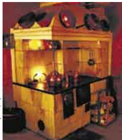
Kuva Helsingin kaupungin museon kuva-artisti Ruiskumestarin talon keittiössä puulieksi hohkaa lämpöä ja kynttilä luo valoa hämärään.

● Helsingin kaupungin Talvipuutarha , Hammar skjöldintie 1 A. Avoinna ti klo 9–15, ke–pe klo 12–15, la–su klo 12–16. Vapaa pääsy.