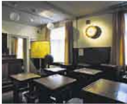
Koulumuseon luokkahuoneen kello kertoo laulutunnin alkavan.

• Koulumuseo, Kalevankatu 39-41, p. 3108 7066 tai 169 3949.