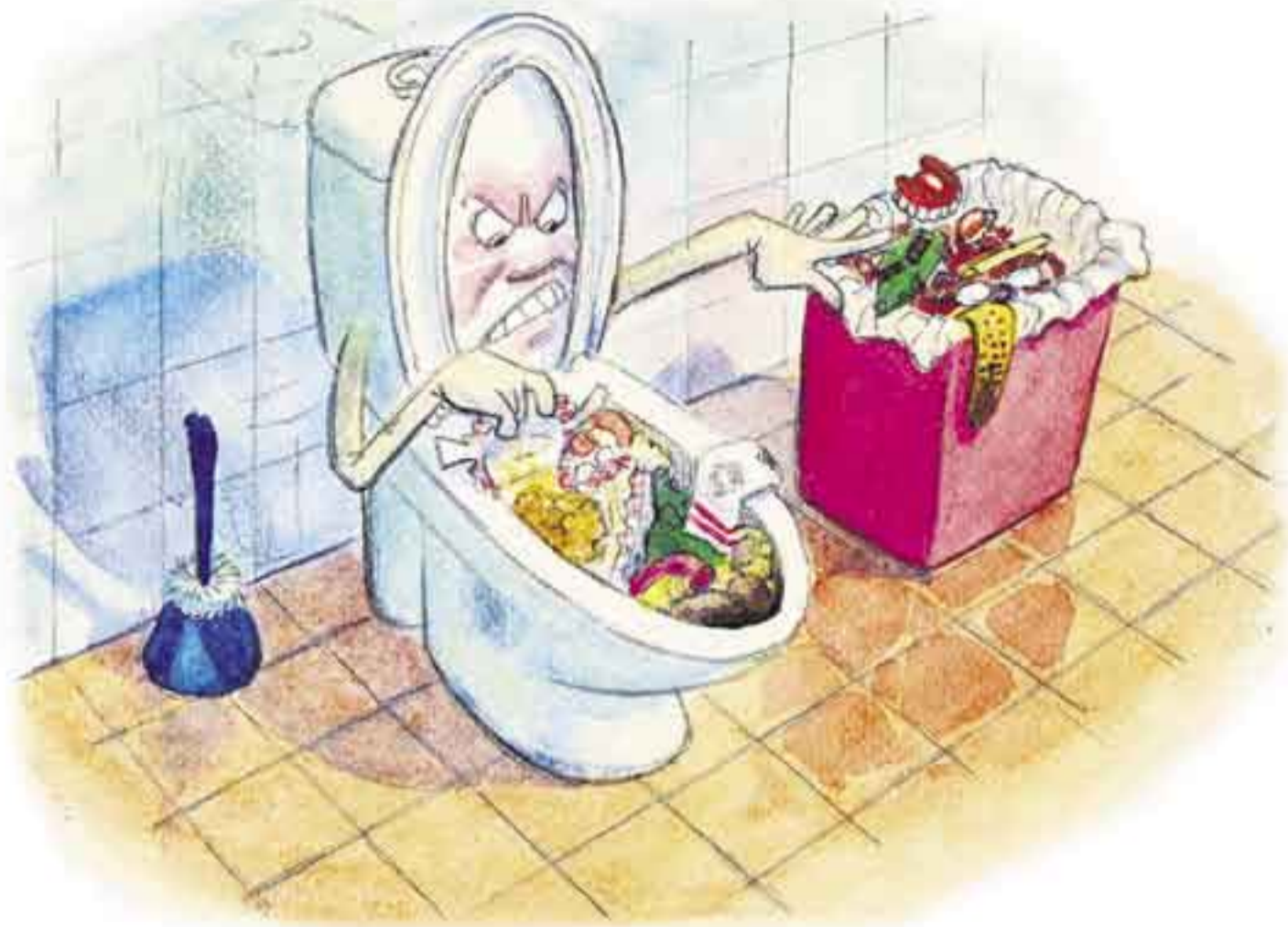
Piirros Arto Nyssönen