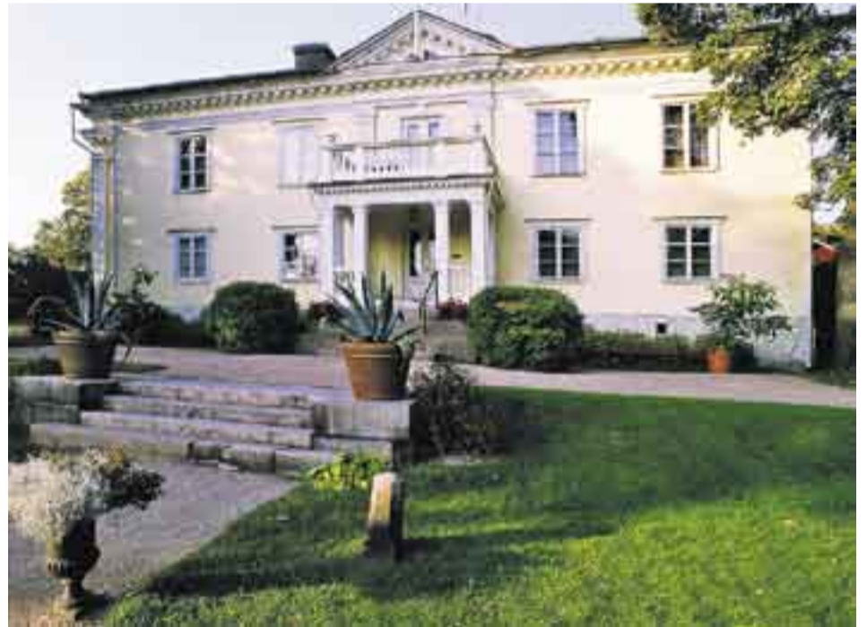
Herttoniemen kartanon päärakennus rakennettiin 1810-luvulla posliinitehtaan polttimon päälle.

Hävityn sodan seurauksena Suomi irrotettiin Ruotsista, ja siitä tuli autonominen suuriruhtinaskunta Venäjän yhteydessä. Maan kehitys sai tästä uuden suunnan, joka vei kohti täyttä itsenäisyyttä. Suomen erottamista Ruotsista oli ajanut jo Anjalan liitoksi kutsuttu upsee-