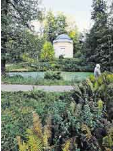
Kartanon puistossa on kaksi Engelin suunnittelemaa uusklassista huvimajaa.