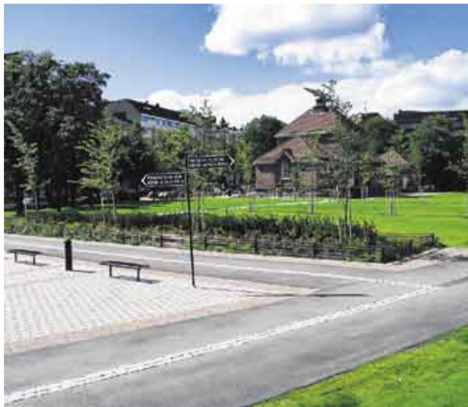
Kuva Helsingin kaupungin rakennusvirasto

Tsunamissa kuolleiden helsinkiläisten lähiomaisille tarjotaan tukea henkiseen jaksamiseen. Helsingin kaupungin psykososiaalisen työn kriisityöntekijät auttavat ja ohjaavat tarvittaessa eteenpäin. Yksin ei tarvitse selvitä. Uhrien omaiset voivat olla yhteydessä kriisityöntekijä Annikka Poussuun , puh. 050-566 5762.