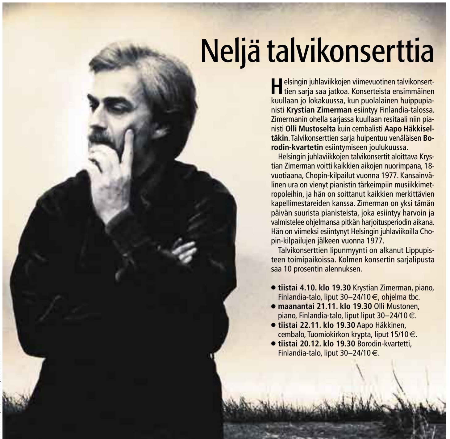
kuvassa Krystian Zimerman