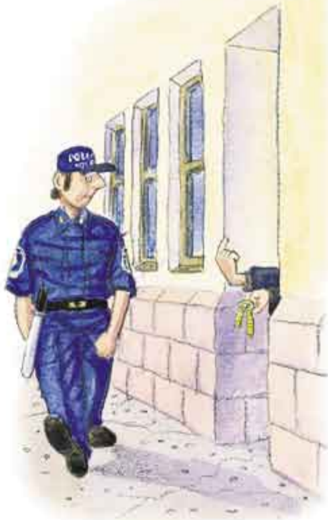
Piirros: Arto Nyysönen

• Järjestyslaki löytyy internet-osoitteesta www.poliisi.fi/jarjestyslaki .