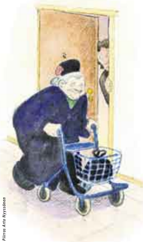
Piirros Arto Nyssönen

Muista tapahtumista tiedotetaan lähempänä ajankohtaa ”Minne mennä” -palstoilla sekä palvelukeskuksissa.