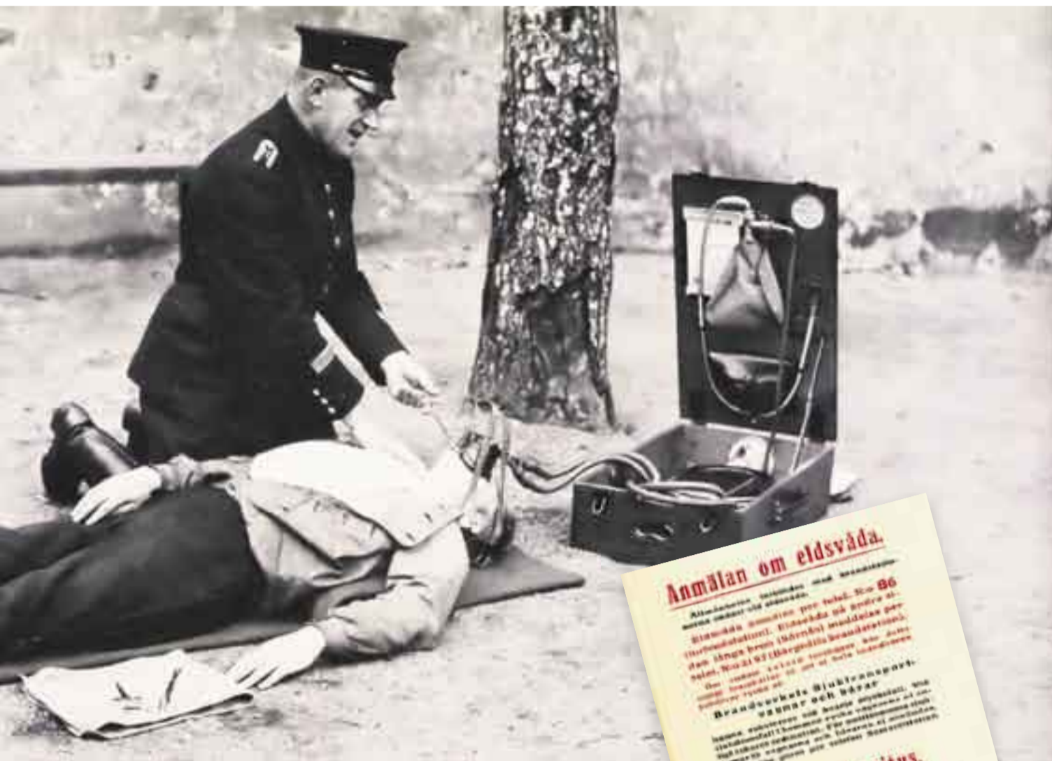
➤ "Erikoisen mielenkiintoinen kone on Bulmoottori, jonka avulla tukehtunut tahi hukunut henkilö voidaan saada koneellisen keinotekoisen hengityksen avulla virkomaan. Tämä nerokas kone on warsin suurenmoinen lisä uudenaikaiseen palokuntakalustoon", kertoi Helsingin Sanomat 22. 10. 1922. Pulmoottori-hapenantolaite oli palokunnan ensimmäisiä ensiapuvälineitä.

taminen oli yksi kartturina toimineen apumiehen tärkeistä tehtävistä. Sota keskeytti kalustokehityksen ja moninkertaisti kuljetusmäärät. Suurten ikäluokkien aikaan kalustoa täydennettiin synnyttäjien käyttöön varatulla "kätilövaunulla". Vuosien varrella moni helsinkiläinen onkin saanut nimensä heidät maailmaan auttaneen palomiehen mukaan.