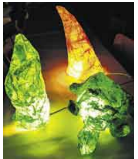
Kilpikonna ja vesikasvit syntyivät paperi-vesiliimaseoksesta.

● 21.9. klo 16–20 avoimet ovet ja maksuttomia työpajoja lapsille ja nuorille Lasten ja nuorten arkkitehtuurikoulu Arkissa, Kaapelitehdas, Tallberginkatu 1 c 106, 5. krs., puh. 685 6426, nettisivut www.arkki.net . Kaapelitehtaalla sijaitseva Galleria Arkki on avoinna arkisin klo 17–20, la klo 10–14.