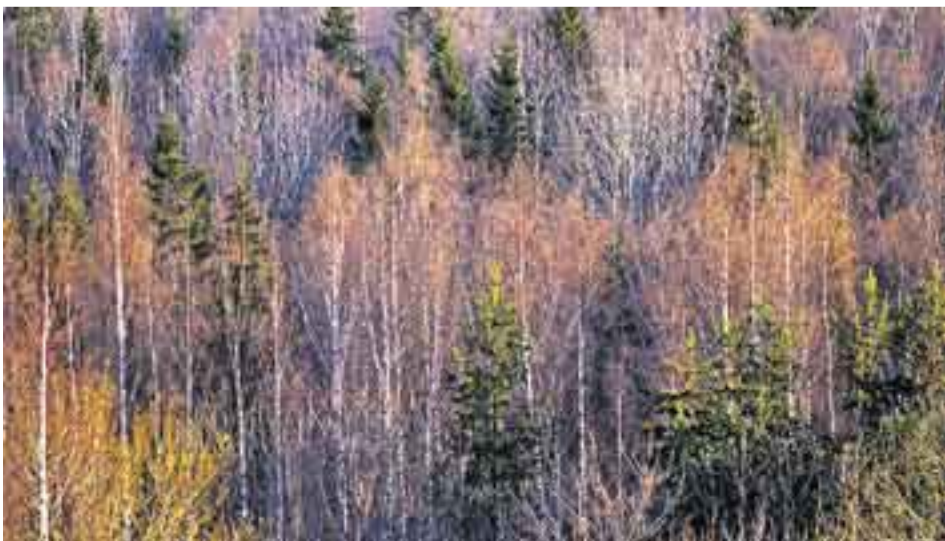
Huhtikuun iltavalossa kylpevä Suomen pääkaupunki Paloheinän täyttömäen laelta tarkasteltuna.

Lähteitä: ● Metsäselvitys 2004. Helsingin metsien hoidon tilanearviointi ja tilaajatoimintojen kehittäminen. Helsingin kaupungin rakennusvirasto. ● Retkiopas Helsingin luontoon. Helsingin kaupungin ympäristökeskus 2000.