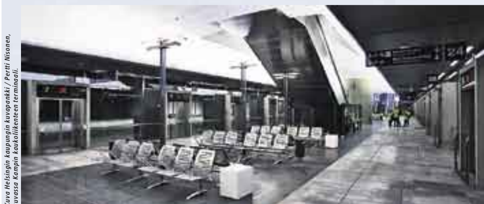
kuvassa Kampin kaukoliikenteen terminaali.

• Lisätietoja www.hkl.fi ja www.ytv.fi -nettisivuilta.