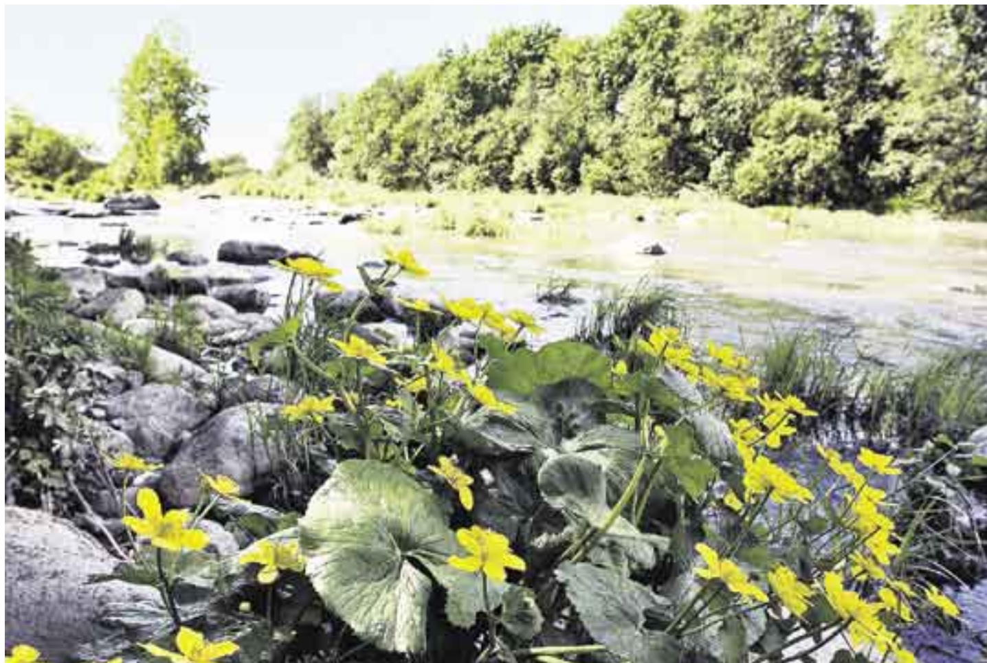
Ruutinkosken seutua Keskuspuiston pohjoisosassa.

ta aluskasvillisuus on raivattu pois. ”Yleisesti ottaen kaupunkilaiset arvostavat sitä, että metsissä pystyy kulkemaan kunnolla”, Immonen sanoo. Metsäluonnon monipuolisuuden vaalimiseksi metsiin jätetään myös lahoppua ja tiheikköjä.