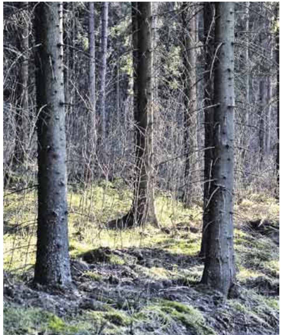
”Metsän seinä on vain vihreä ovi.” (Risto Rasa)