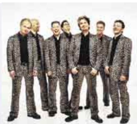
Taiteiden yönä Malmitalossa esiintyy täplikäs Gebardi.