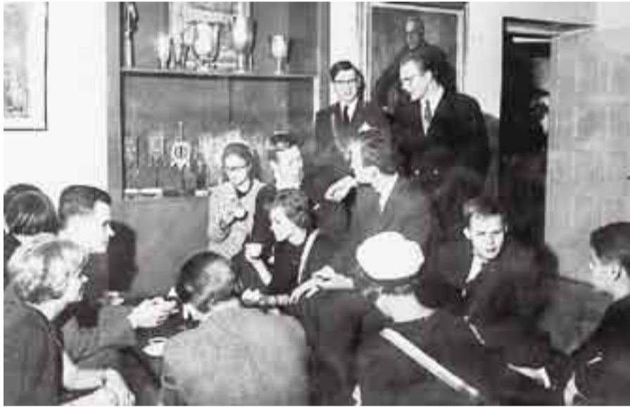
Kahvihetki osakunnan 60-vuotisjuhlinnan lomassa 9. 10. 1965.

Osakunnilla on omat perinteiset kotimaakuntansa ja järjestöjen lippua yleensä koristaa maakuntavaakuna. Eteläsuomalaisilla ylioppilailta, esolaisilla, se on Uudenmaan vaakuna. Sata vuotta sitten Suursaariin kuului esolaisten etupiiriin. Helsinkiläistäustaiset ovat kuitenkin koko ESON historian olleet hallitsevassa asemassa ja niinpä hekin ovat täysin rinnoin juhlatilaisuuksissa