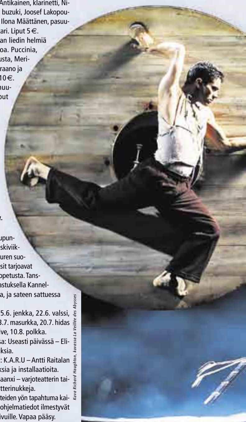
Kuva Richard Haughton, kuvassa La Veillée des Abysses

● 31.8.–24.9. Juhani von Boehmin maalauksia. Vapaa pääsy.