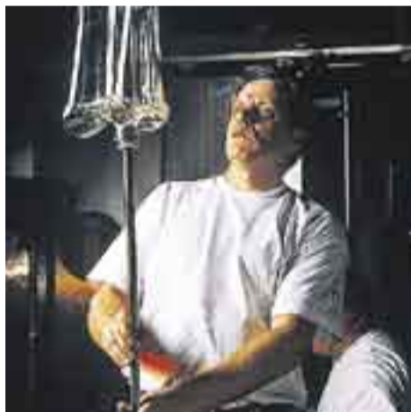
litalan lasitehtaalla syntyvät myös Aaltovaasit. Lasinpuhaltaminen vaatii taitoa ja tarkkuutta.

Opistolle ostetaan vuodessa kolmisenkymmentä uutta hevosta. Osa hevosista pääsee ”eläkkeelle” ja jotkut joudutaan myymään siksi että ne ovat osoittautuneet sopimattomiksi opiston tarkoituksiin.