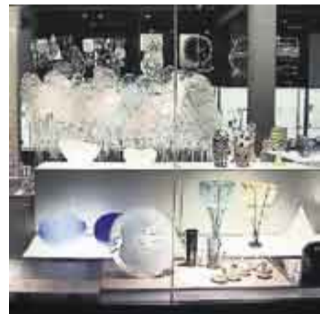
Riihimäen lasimuseon näyttelyissä hehkuu lasi kaikissa väreissään.