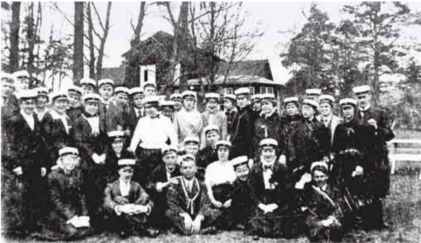
Osakuntalaisia vapunpäivän retkellä Munkkiniemessä vuonna 1915.