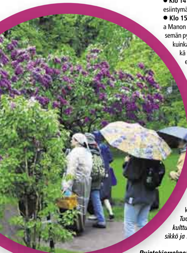
Puistokierroksella yleisö ihastelemassa henkeäsalpaavan kauniita Eiran puiston syreenejä.