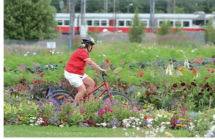
Vantaankosken rataa (Kehärata) jatketaan lentoaseman kautta Tikkurilaa päädalalle.

Maaltamuuton paineessa vuonna 1968 syntyi idea lähijunaradan vetämiseksi Huopalahdesta pohjoiseen. Sen varteen suunniteltiin 130 000 asukkaan nauhakaupunkia. Uusi Kehärata lentoaseman kautta pääradalle valmistuu 2015.