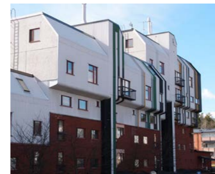
Erskinen omaperäistä arkkitehtuuria

Salpausselältä alkava Vantaanjoki laskee tästä länteen yhä erottuvaa Djupbäckin uomaa pitkin parintuhannen vuoden ajan ennen ajanlaskun alkua. Vähitellen vesi kulutti hiekamaahan uuden uoman kalliokynnyksen ohi itään. Vanha uoma soistui nykyiseksi Mätäojaksi ja sen varren monituhattavuotinen asutus taantui.