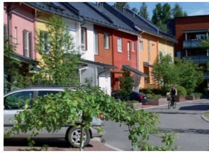
Vuorenjuuren townhouse-tyyppiset talot

Tiiviin ja matalan kaupunkirakentamisen kokeilualue valmistui 2006. Asukkaat ovat itse urakoineet 20 englantiilaistyyppistä kytkettyä "townhouse"-kaupunkientaloa. Naapurissa Toiskantiellä on 1980-luvun versio samasta aiheesta, suunnittelija arkkitehti Timo Vormala.