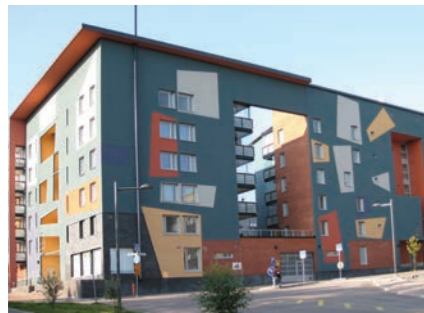
Kiliterinmäki on värikäs.

Valmistui 1975, suunnittelija arkkitehtitoimisto Lehtovuori, Tegelman, Väänänen. Öljykriisin jälkeisessä lamassa radan suunnittelussa pyrittiin kustannusten minimoimiseen myös asemarakennusten osalta. Asema sekä viereinen Myyrmäen bussiterminaali ovat tulevan Kehäradan ja koko Länsi-Vantaan joukkoliikenteen solmukohta. Sen kautta kulkee tulevaisuudessa myös Vuosaaresta lähtevä seudullinen bussilinja Jokeri 2.