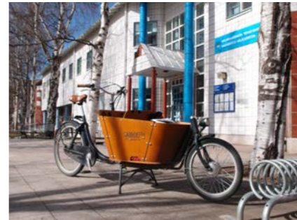
Pyörällä pääsee palveluihin

Länsi-Vantaan suosituin viheralue levittäytyy 30-metrinen kallioharjanteiden ympärille. Pohjoisrinteiltä löytyy niin muinaisrantoja kuin hyviä pulkkamäkiäkin. Alueella on kotoja, niityjä ja reheviä lehtoja. Vaateliatia lehtolajeja ovat pähkinäpensas, näsiä ja lehtokuusama sekä rauhoitettu lehtoneidonvaippa, jolla on Vantaalla vain kaksi tunnettua esiintymää. Metsässä viihtyvät mm. lehtopöllö, palokärki, pikkutikka sekä peukaloineen, joka usein pesii kaatuneen puun juurakon kätöksissä.