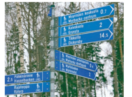
Fillaripolkuja on yli 30 km.

Vanha Hämeenkyllän ja Kaarelan rajakivi on nykyisellä Vantaan ja Helsingin rajalla. Aivan kivenheiton päässä on myös Espoon koillis- kulma. Muistolaatan kiinnittivät vuonna 1994 suomalaisen kotiseutuliikkeen 100-vuotis- juhlavuoden kunniaksi Helsingin, Espoon ja Vantaan kaupunginosayhdistykset.