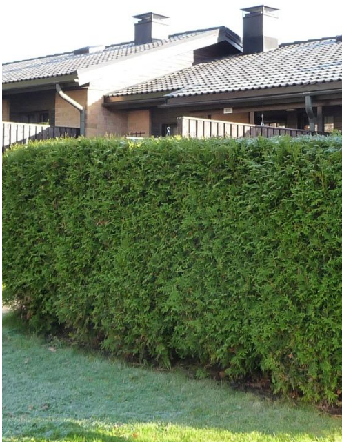
Bilder 16 och 17. Växtarten och skötselsättet har en väsentlig inverkan på slutresultatet. På bilden till vänster har smaragdtujorna med sitt spetsiga konformade växtsätt lämnats oklippta, varvid häcken har blivit för hög. Den ojämna kanten upptill ser inte bra ut. Som art i häcken till höger har använts pyramidtuja som lämpar sig för klippning. Som klippt ryms häcken även på små utrymmen.