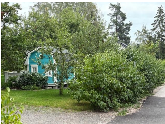
Bild 14. (Ovan) Syrenhäcken på bilden befinner sig ännu i plantstadiet. Om den inte klipps, växer busken rejält ut på gatuområdets sida. Plantorna ska planteras på tomten så, att de också som oklippta har rum att växa på den egna tomtens sida.