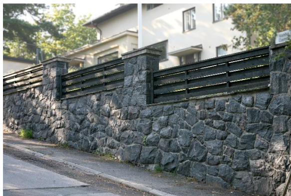
Bild 2. Bilden visar ett i detaljplanen skyddat område, där planen förutsätter att tomten avgränsas med murar, planteringar eller staket. Den gamla muren har hållits i skick och trädelarna har förnyats under årens lopp.

Det är också möjligt att det i detaljplanen inte ingår några bestämmelser om ingärdande och att området inte hör till RKY-objekten, men för området har utarbetats regionala anvisningar om planering, byggnadssätt och reparationssätt. I dessa anvisningar kan ingå anvisningar med tanke på stadsbilden som gäller gårdsområden och som ska iakttas. Anvisningarna finner man på Helsingfors stads webbplats under Regionala planeringsanvisningar.