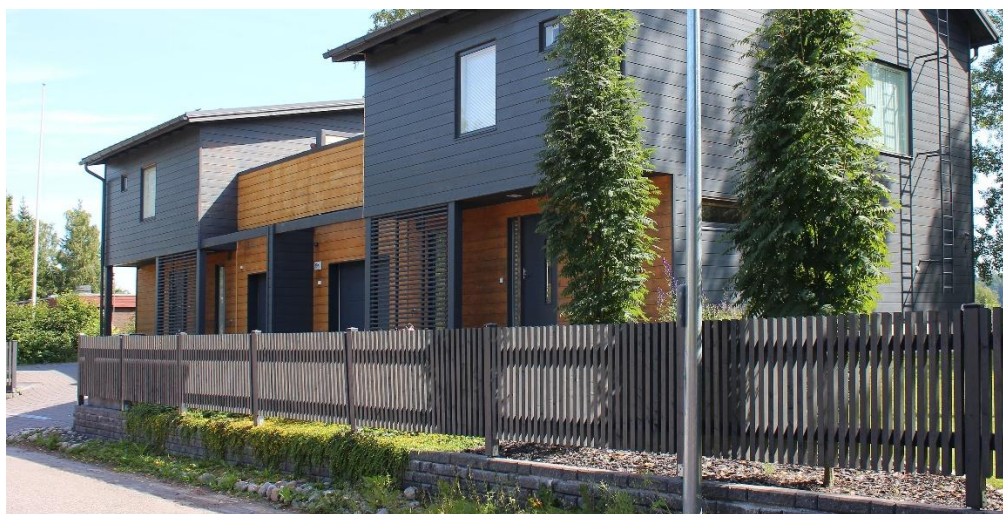
Bild 3. Staketet på bilden har passats in i byggnadens arkitektur.

Staketets material, höjd och färgsättning bör passa ihop med byggnadens arkitektur och eventuella staket på granntomterna. Färgsättningen behöver inte framhäva staketet. Till exempel ett helvitt staket kan onödigt mycket framhävas i landskapet.