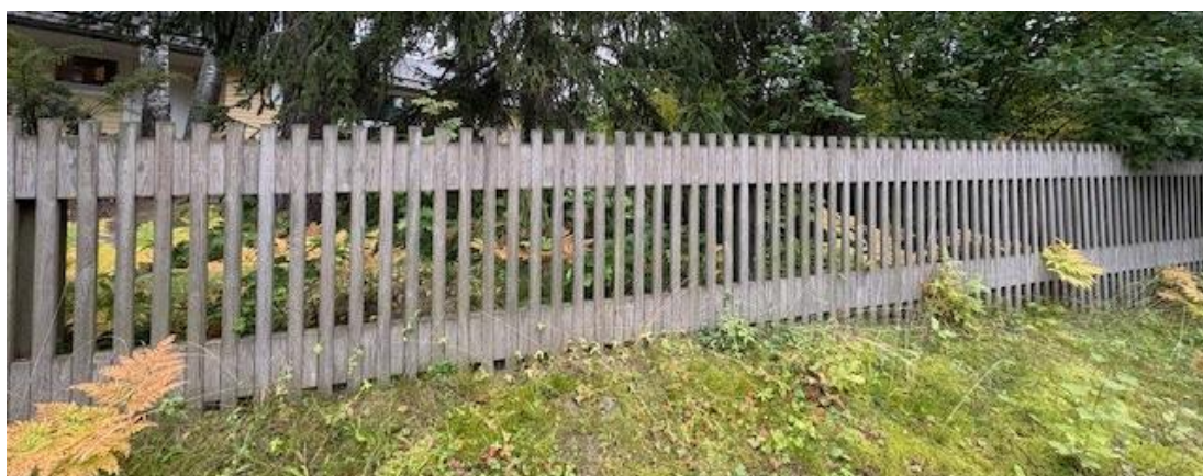
Bild 9. Ett egenartat staket byggt på ett gammalt småhusområde är skickligt inpassat i terrängen.

Det rekommenderade mellanrummet mellan staketets nedre kant och markytan är högst 100 mm. Ett större avstånd försämrar staketets utseende och funktionalitet.