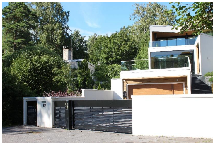
Bild 13. En mur och port som arkitektoniskt passar in i en modern byggnad.

Om man vill bygga såväl en inkörsport som en ingångsport till tomten parallellt med varandra, rekommenderas att portarna planeras så, att de kan öppnas till en enda bred trafikled.