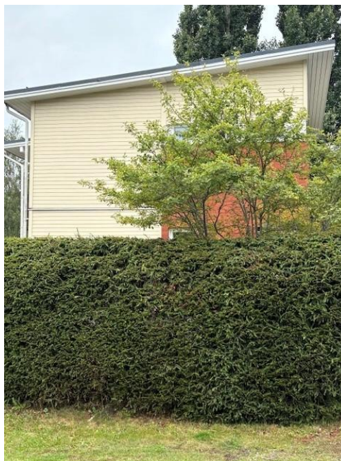
Bild 15. (Till höger) Vintergröna häckar ska alltid klippas så att höjden och bredden hålls under kontroll. Den omsorgsfullt skötta och med klippning låghållna granhäcken på bilden är vacker. Som vintergrön skyddar den gården även om vintern.