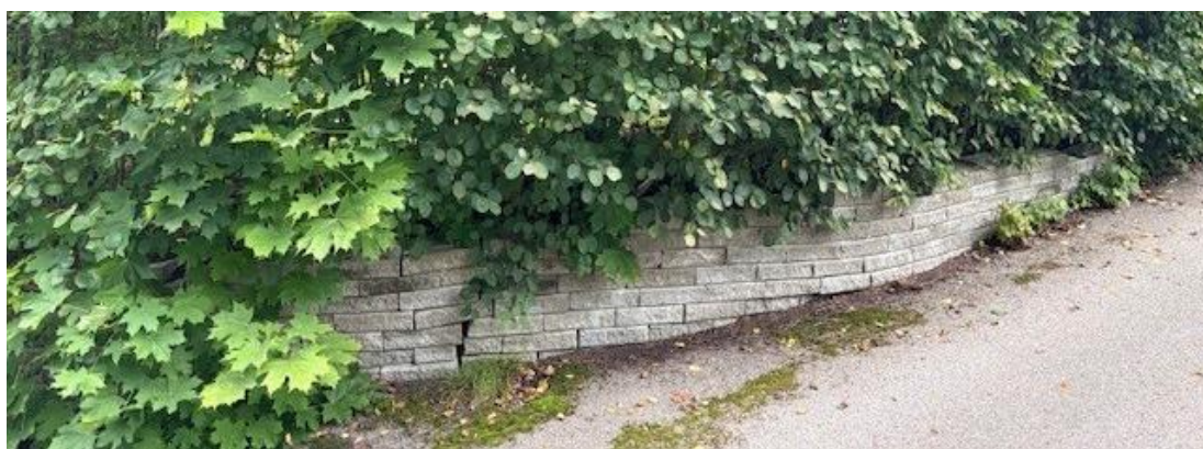
Bild 12. Stödmuren på bilden har byggts av stapelbara murstenar som inte kan bindas samman till en stadig konstruktion. Stödmuren har inte heller grundats ordentligt. Stentypen på bilden lämpar sig endast för mycket låga stenkanter.

Bilder 10-11. I objektet har valts fel sätt att bygga en stödmur på gränsen mot gatan. Stenkorgsmurar lämpar sig inte för detaljrika former. Man har varit tvungen att lösa problempunkten genom att byta typen av mur, vilket inte lett till något gott slutresultat. Stenkorgsmurar lämpar sig inte heller som grund för staket. I detta objekt började staketet luta redan ett år efter byggandet.