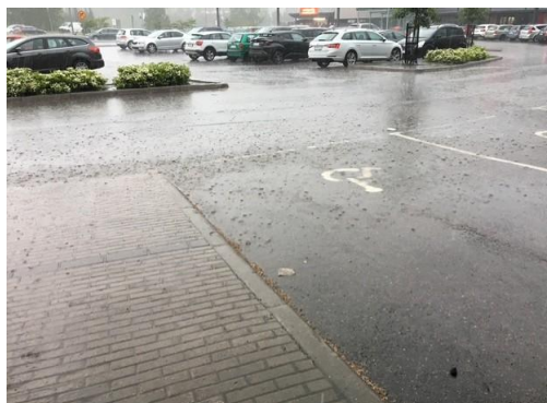
Bild 2–5: Människan ökar själv mängden dagvatten genom att uppföra byggnader och belägga marken med ogenomsläppliga material. Avledning av dagvattnen i ett underjordiskt rörledningssystem är en osäker lösning som kräver underhåll då risken för plötsliga störtregn ökar. Det leder också till att marken torkar ut för mycket. Syftet med bestämmelserna om avledning av dagvatten är att förebygga olägenheter.