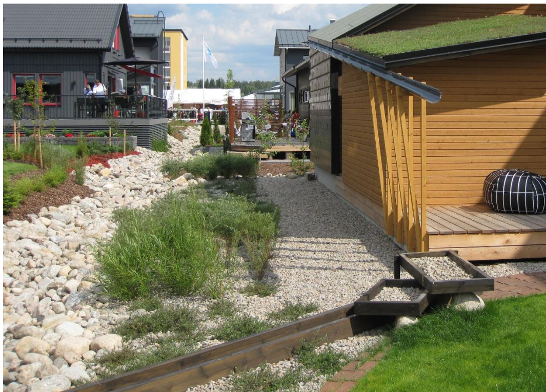
Bild 8. Exempel på arrangemangen för dagvattenhantering i området för bostadsmässan i Jyväskylä.