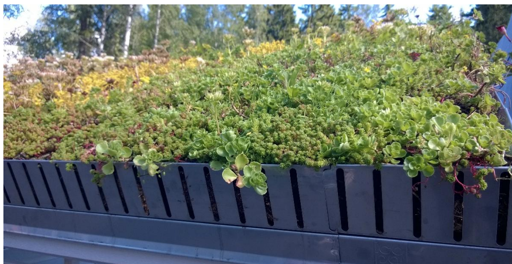
Bild 9. Ett grönt tak kan användas som en del av dagvattnens fördröjningssystem, om växtunderlaget är tillräckligt tjockt. Växtunderlagets tjocklek inverkar också på hur växtligheten frodas, eftersom också växter som är anpassade till torra på ett för tunt växtunderlag helt kan torka bort vid gassande sol utan att längre repa sig.