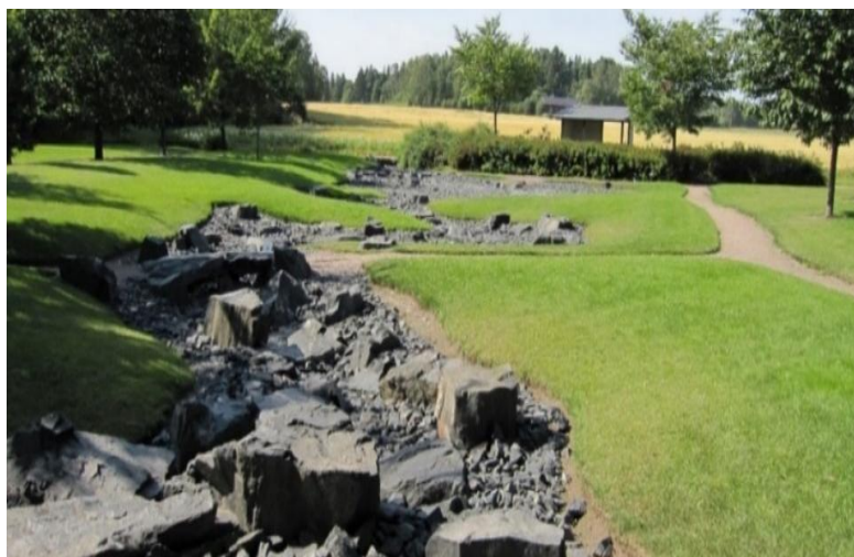
Bild 1. Konstruktion som fördröjer dagvattnet i Eko-Vik.

Skadeverkningarna av extrema väderförhållanden kan effektivt förebyggas med användning av genomsläppliga ytmaterial på gårdarna och med infiltrering och fördröjning av dagvattnet. Ett ekologiskt system för dagvattenhantering renar också dagvattnet från orenheter, ökar naturens mångfald i stadsmiljön och tjänar som bäst som ett element som ökar trivseln på tomten.