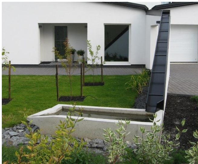
Bild 7. Det är skäl att förhålla sig till dagvatten som något nyttigt, inte skadligt. Det är mycket förnuftigt att utnyttja takvattnen för bevattning i trädgården. Bild av bostadsområdet Vuores i Tammerfors, där dagvattnet som uppkommer på taket till ett småhus på ett modernt och innovativt sätt letts till en liten vattenbassäng. Motsvarande traditionell lösning vore en så under stupröret.