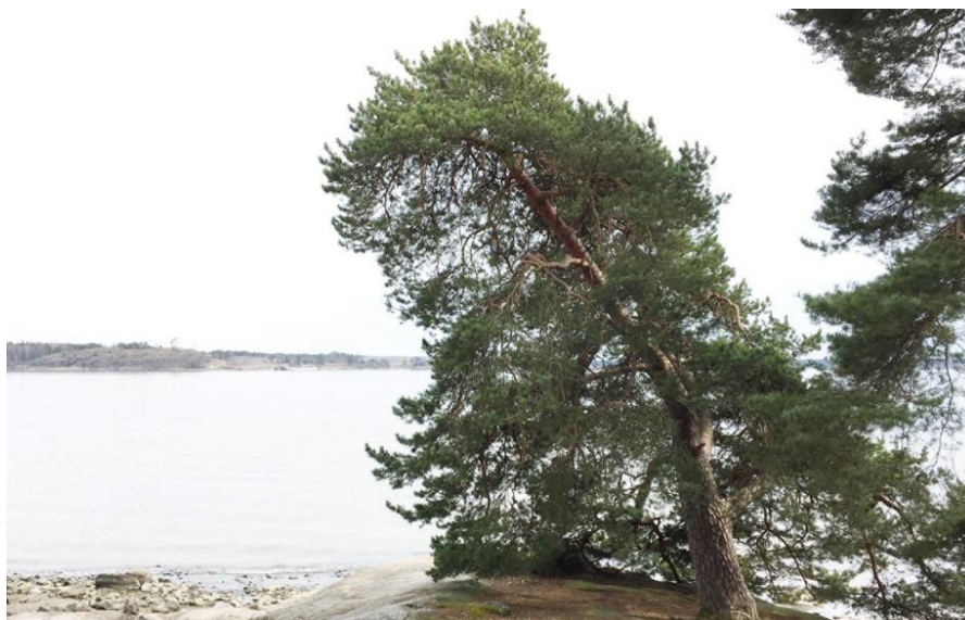
Bild 3. Även enskilda träd kan ha stor betydelse i landskapet.

Synerförrättningsteamet bistår vid behov också sektorerna och affärsverken som verkställer en plan i informerandet om projektet och i ordnandet av samarbetet mellan olika instanser. Synerförrättningsteamet kommer vid behov med förslag på hur vidtagandet av nämnda åtgärder och tillsynen kan utvecklas.