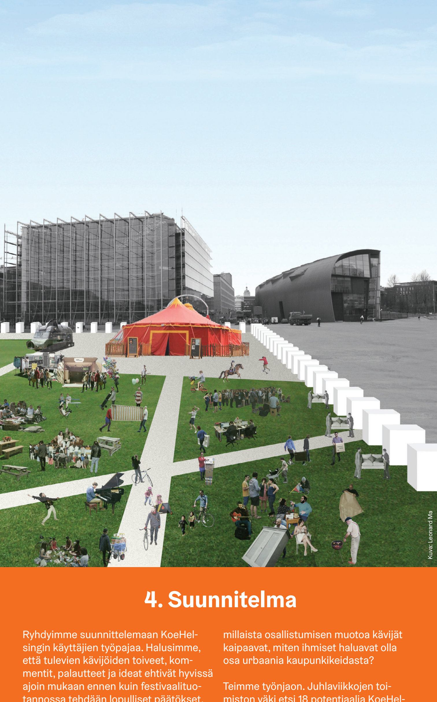
Kuva: Leonhard Mita

teneille ideoille, erityisesti esimerkiksi alueelle nouseva Roskalavapaviljonki. Yhdessä Juhlaviikkojen työryhmän kanssa päädyimme siihen, että tämän lisäksi otettaisiin sisäiseen kehittämistyöhön avuksi myös pieni KoeHelsinki-kävijöiden joukko, joiden kanssa testattaisiin työpajassa suunniteltuja KoeHelsingin ohjelmasta ja palveluista. Ajatuksena oli löytää eri kohderyhmistä mahdollisia oikeita kävijöitä asiantuntijoiksi. Testiryhmän kanssa voitaisiin vilaila KoeHelsingin sisällön, tapahtumapaikan ja viestinnän suunnitelmia käyttäjäryhmien ajatuksia paremmin vastaaviksi.