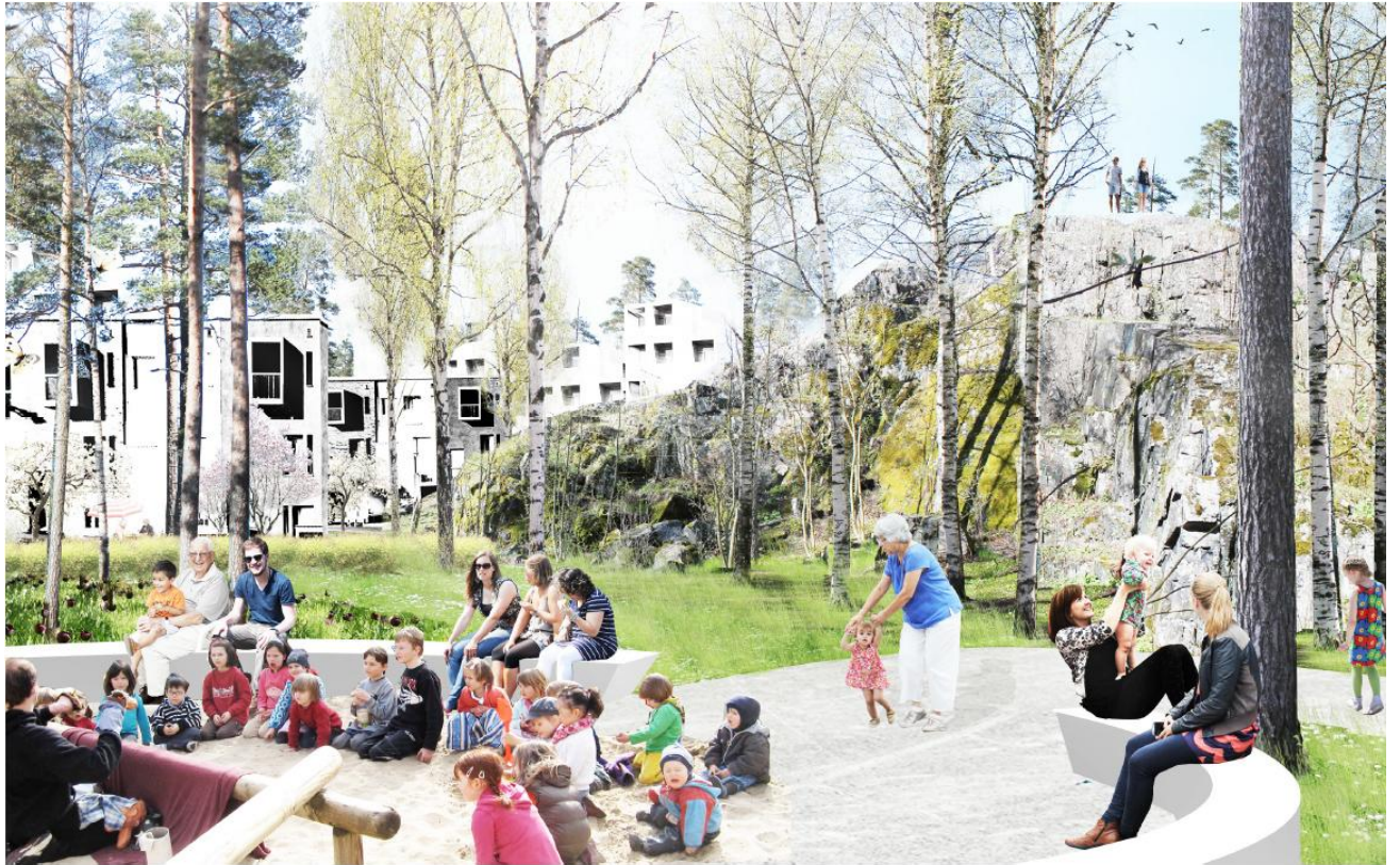
Kuva 3. Meri-Rastilan Pohjavedenpuiston havainnekuva.