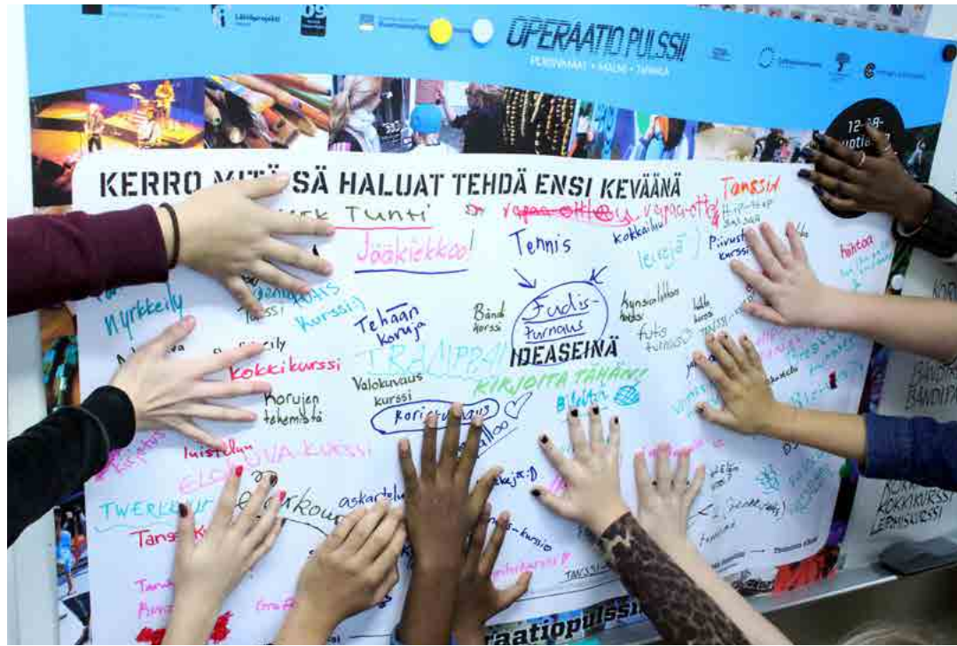
Operaatio Pulssissa nuoret suunnittelevat itse harrastustoimintaa.