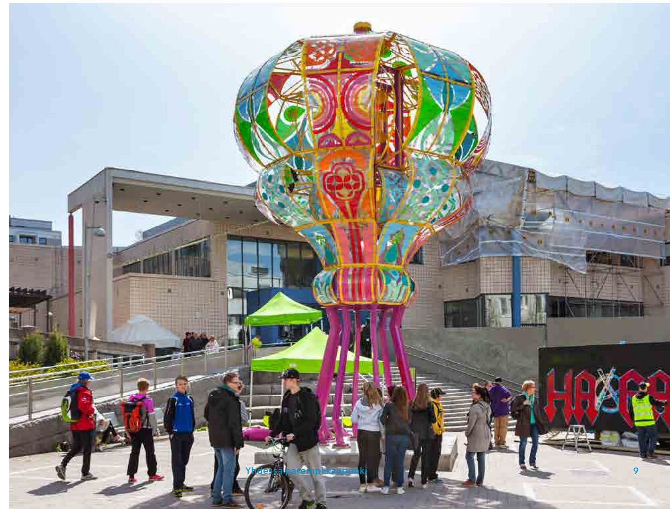
Unelma-taideteos on Kannelmäen Sitratorilla.

Nykyisellä kaudella ja toimintansa 20-vuotisjuhla- vuotena 2016 Lähiöprojekti keskittyy erityisesti Jakomäen, Kannelmäen, Malmin, Malminkartanon, Meri-Rastilan ja Pohjois-Haagan alueisiin. Alueellisen toiminnan lisäksi säilyy joustavuus koko esikaupunkialueen kehittämisessä.