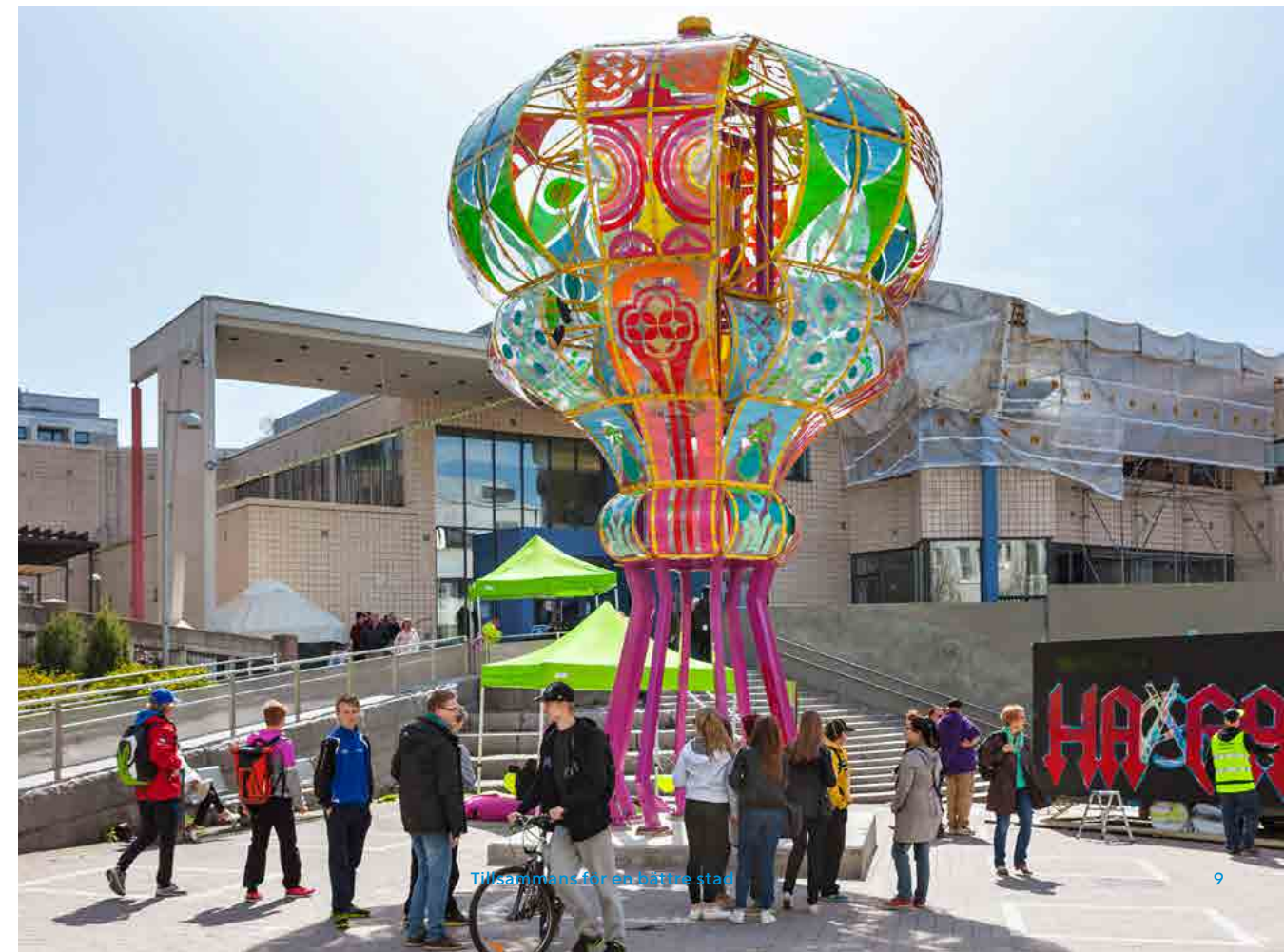
Konstverket Unelma (Drömmen) på Cittertorget i Gamlas.

Under den pågående perioden och 20-årsjubileet för sin verksamhet år 2016 fokuserar Förortsprojektet särskilt på Jakobacka, Gamlas, Malm, Malmgård, Havsrastböle och Norra Haga. Utöver den områdesspecifika verksamheten bevaras flexibiliteten i utvecklandet av hela förstadsområdet.