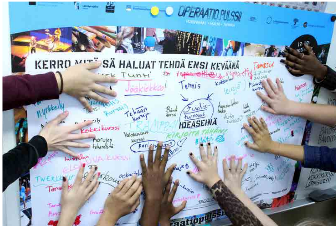
I Operation Pulsen planerar de unga själv sin hobbyverksamhet.