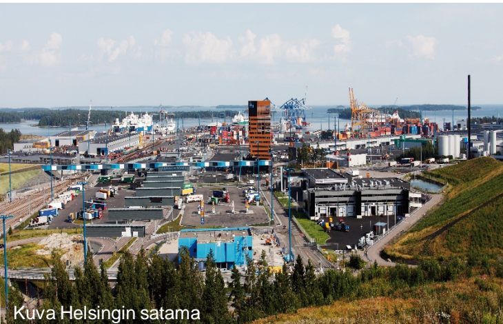
Kuva Helsingin satama