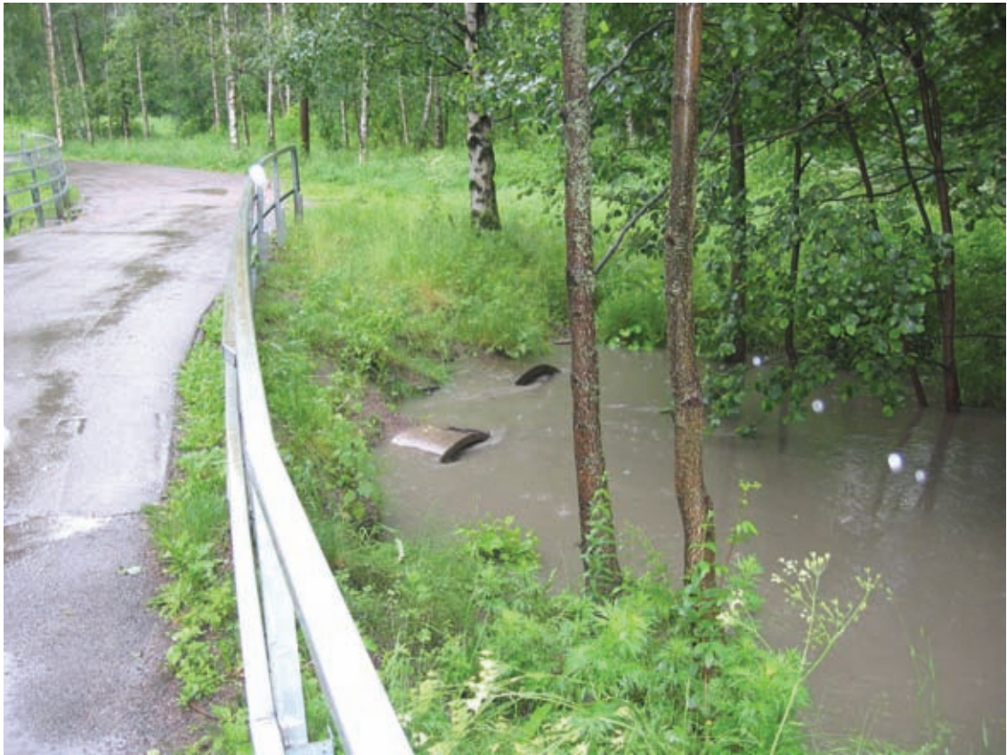
Kuva. Hulevesitulva Mustapurossa (ympäristökeskus)