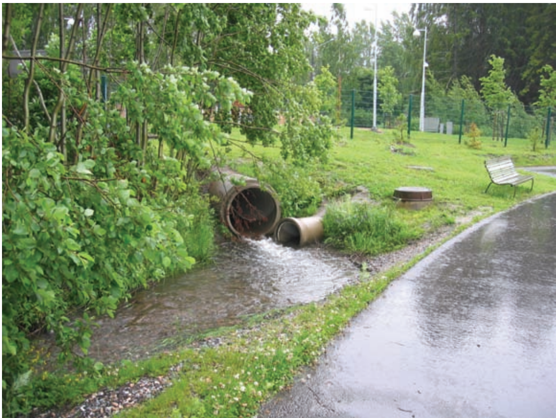
Kuva. Hulevesiviemäröintiä Keski-Helsingissä (ympäristökeskus)