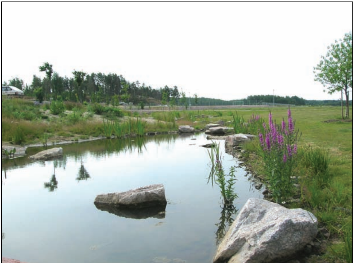
Kuva. Luonnonmukaistettua Viikinojaa