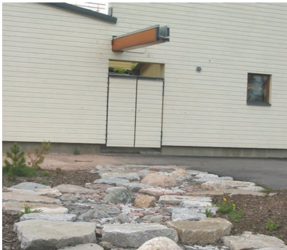
Kuva. Kattovesien johtamista Koillis-Helsingissä (rakennusvirasto)