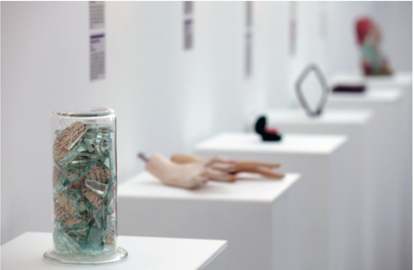
MUSEUM OF BROKEN RELATIONSHIPS

Esineet kertovat yleisinhimillistä tarinaa rakkaudesta ja menetyksestä. Näyttelykävijä voi uppoutua lukemaan tekstejä, joiden pituus vaihtelee muutamasta sanasta useampaan sivuun. Tunnelmat vaihtelevat: on katkeraa tilitystä ja iskeviä kiteytyksiä,