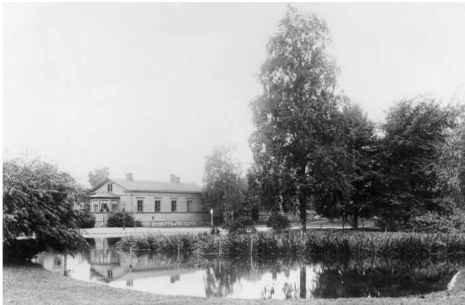
Kaisaniemen lammikon rannalla sijainnut kylpylähotelli Villensauna aloitti toimintansa 1860-luvulla.

HELSINGIN KAUPUNGINMUSEO / DANIEL NYBLIN, 1890