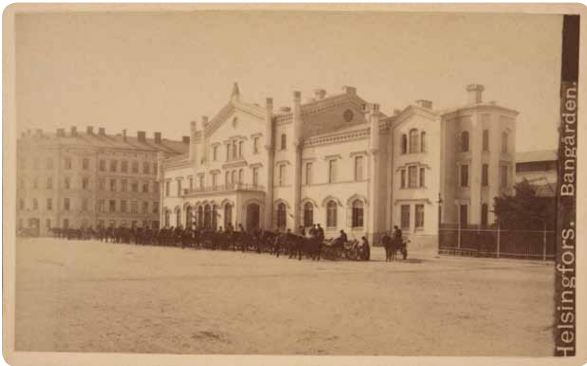
Helsingin ensimmäinen rautatieasema valmistui 1862.