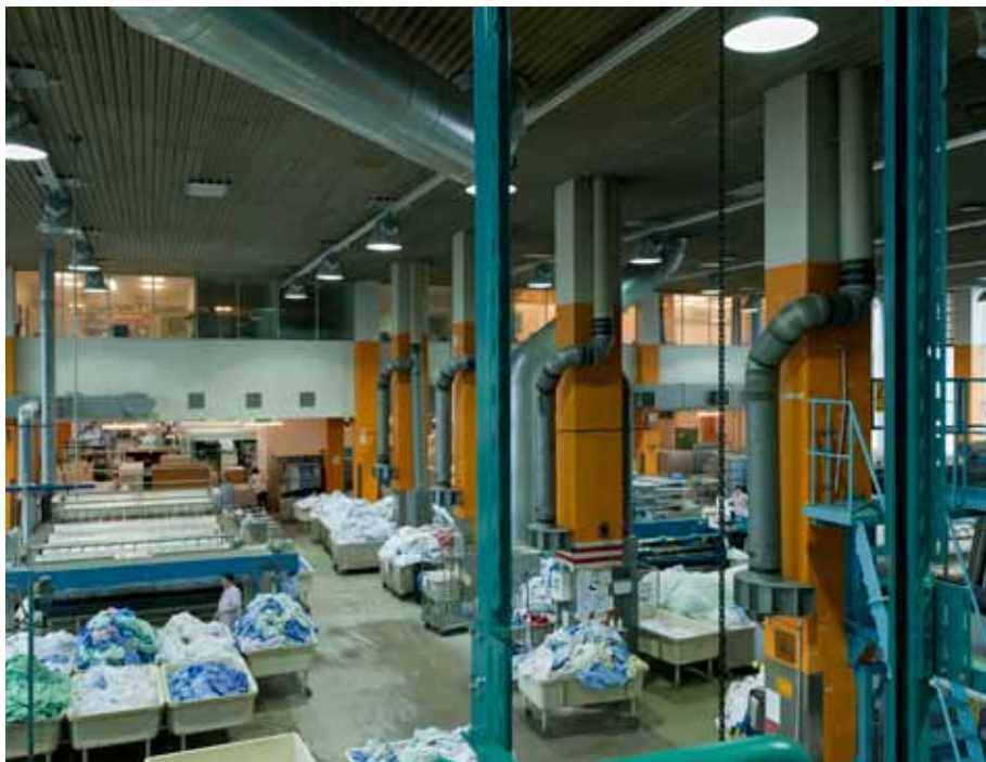
Tuotantohallissa ovat kaikki pesukoneet, kuivaus ja mankelointi. Pesulan 93 työntekijää työskentelevät kahdessa vuorossa.