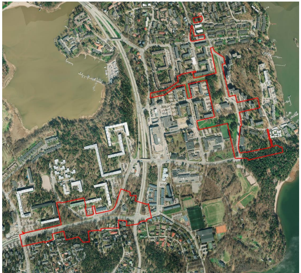
Koirasaarentien ja Ilomäentien alueet Yliskylän pohjoisosassa. Kaava-alueen raja on punaisella.

OSALLISTUMIS- JA ARVIOINTISUUNNITELMASSA (OAS) esitetään miksi kaava laaditaan, miten kaavoitus etenee ja missä vaiheessa siihen voi vaikuttaa. Osallistumis- ja arviointisuunnitelmaa täydennetään tarvittaessa kaavaprosessin edetessä, jolloin OAS:n päivitetty versio löytyy Helsingin karttapalvelusta kartta.hel.fi/suunnitelmat .