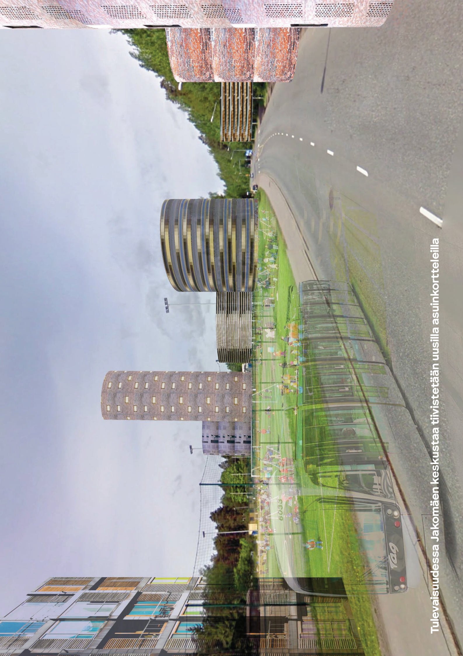
Tulevaisuudessa Jakomäen keskusta tiivistetään uusilla asuinkortteleilla