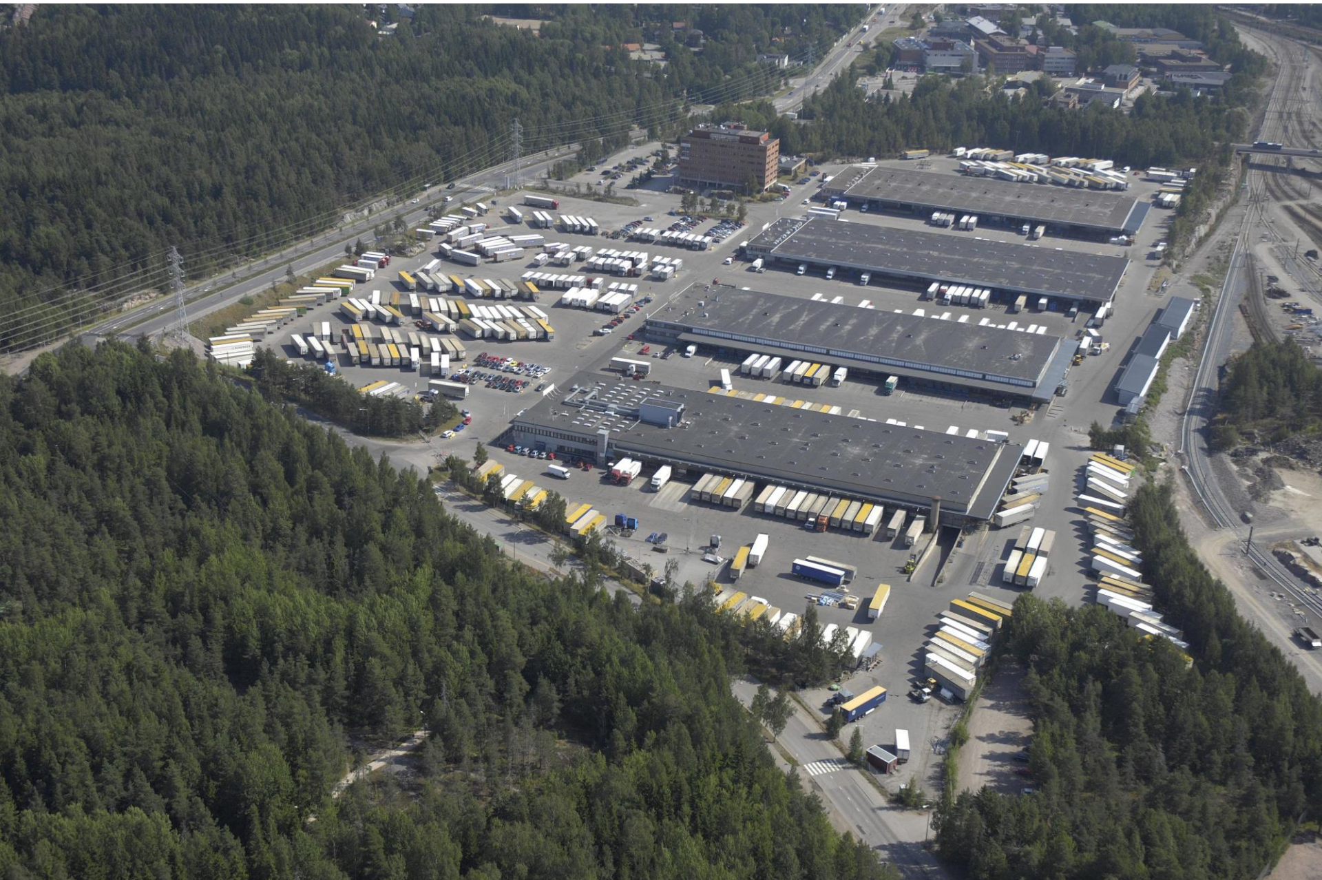
Alueen nykytilaa: raskaan liikenteen kenttiä ja terminaalirakennuksia, toimistotalo, suurjännitejohto