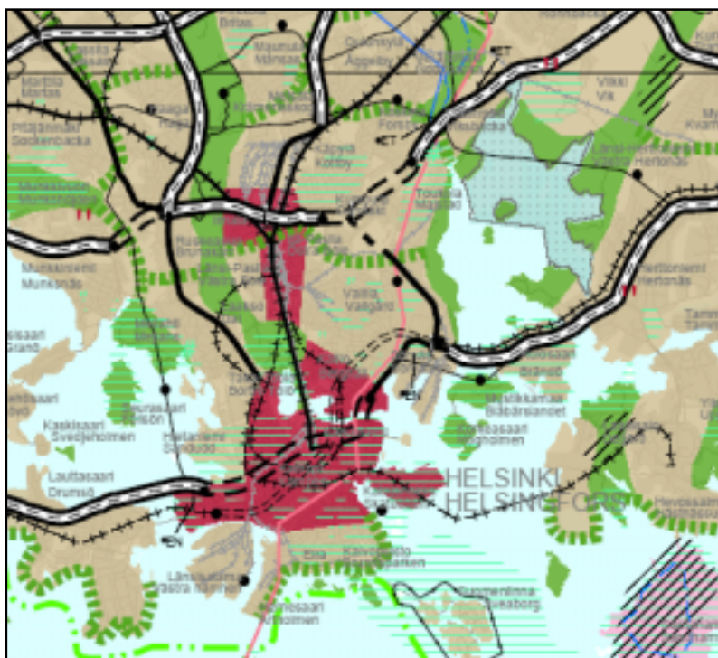
Ote Uudenmaan maakuntakaavasta

Uudenmaan maakuntakaavan on Maakuntavaltuusto hyväksynyt 14.12.2004 ja parhaillaan se on ympäristöministeriössä vahvistettavana. Maakuntakaavassa Kalasataman alue on pääosin taajamatoimintojen aluetta, samoin kuin voimassa olevassa seutukaavassa. Energiahuollon alue on merkitty Hanasaareen kohdemerkinnällä. Myös alueelle idästä saapuva 400 kW voimalinja on maakuntakaavassa. Itäväylän pohjoispuoliselle ranta-alueelle on merkitty virkistysaluevaraus, joka jatkuu yhtenäisenä vyöhykkeenä Toukolan rantapuistoon. Kalasataman osayleiskaavaluonnos noudattaa maakuntakaavan maankäyttölinjauksia.