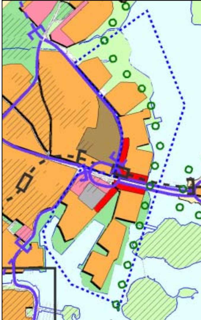
Ote Yleiskaava 2002:sta

Yleiskaava 2002:ssa on valtakunnallisten alueidenkäyttötavoitteiden mukaisesti tutkittu mahdollisuudet yhdyskuntarakenteen eheyttämiseen, eikä uusia huomattavia asuin- tai työpaikka-alueita ole sijoitettu irralleen olemassa olevasta yhdyskuntarakenteesta. Helsingin pääkaupunkiasemaa ja kansainvälistä edustavuutta on pidetty tärkeinä lähtökohtina. Olemassa olevia rakenteita on hyödynnetty ja pyritty edistämään elinympäristön laadun parantamista. Yleiskaavan keskeisinä lähtökohtina ovat 1990-luvun voimakas väestönkasvu ja ennusteet tulevasta kasvusta sekä toisaalta nykyisen väestön asumistason parantamistavoite.